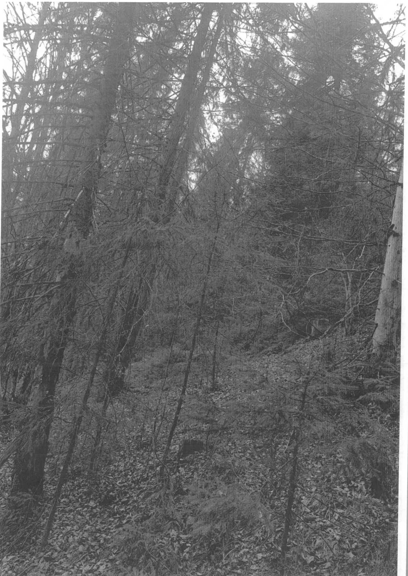
Forest scene with many bare trees and ground covered in fallen leaves.