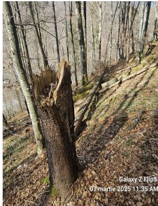
Galaxy Z Flip5 07 martie 2025 11:35 AM