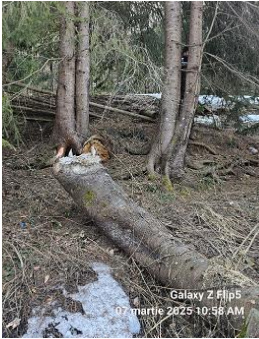
Galaxy Z Flip5 07 martie 2025 10:58 AM