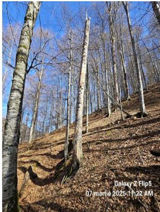
Galaxy Z Flip5 07 martie 2025 11:22 AM