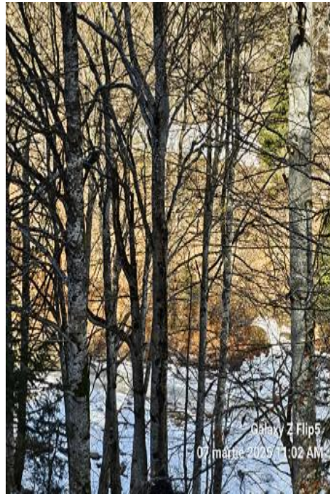
Galaxy Z Flip5 07 martie 2025 11:02 AM