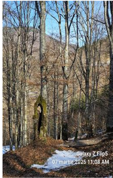
Galaxy Z Flip5 07 martie 2025 11:08 AM