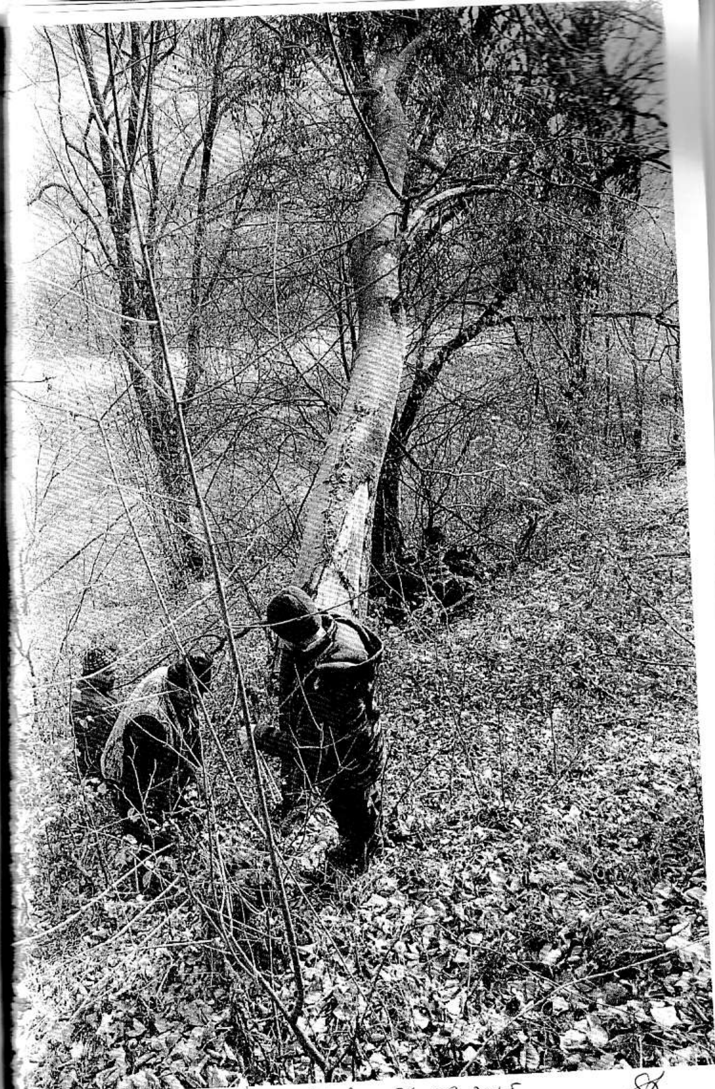
17 A5 Silberstein-BH = no 35 A, 26 02 2015