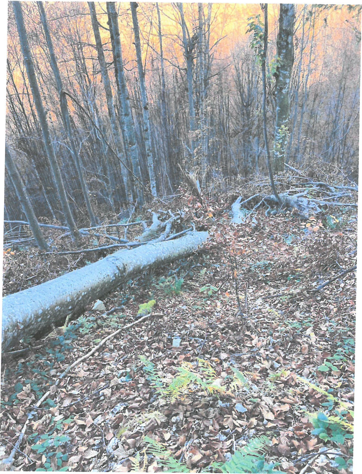
UP III, Ua 82A