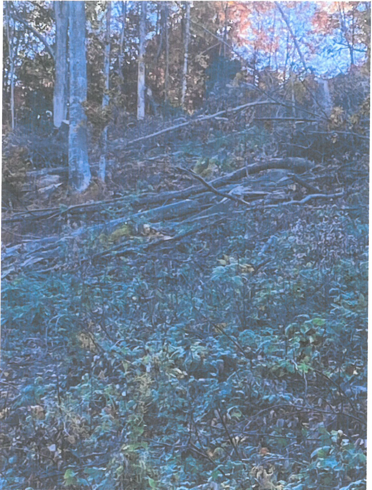
UP III, Ua 82B