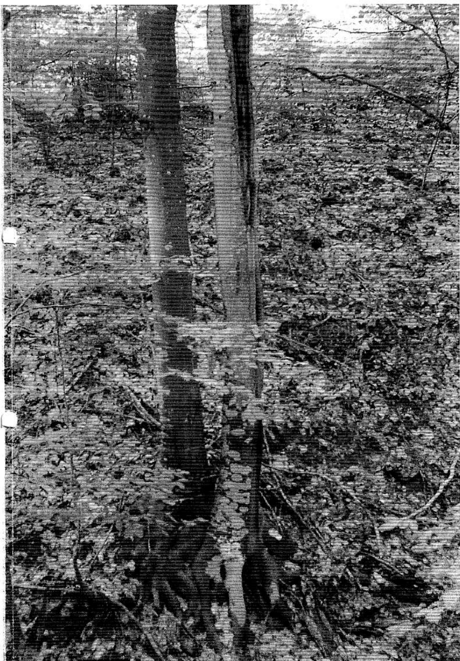
UPAS Carambo. era 82A Ora 11 00 - 58