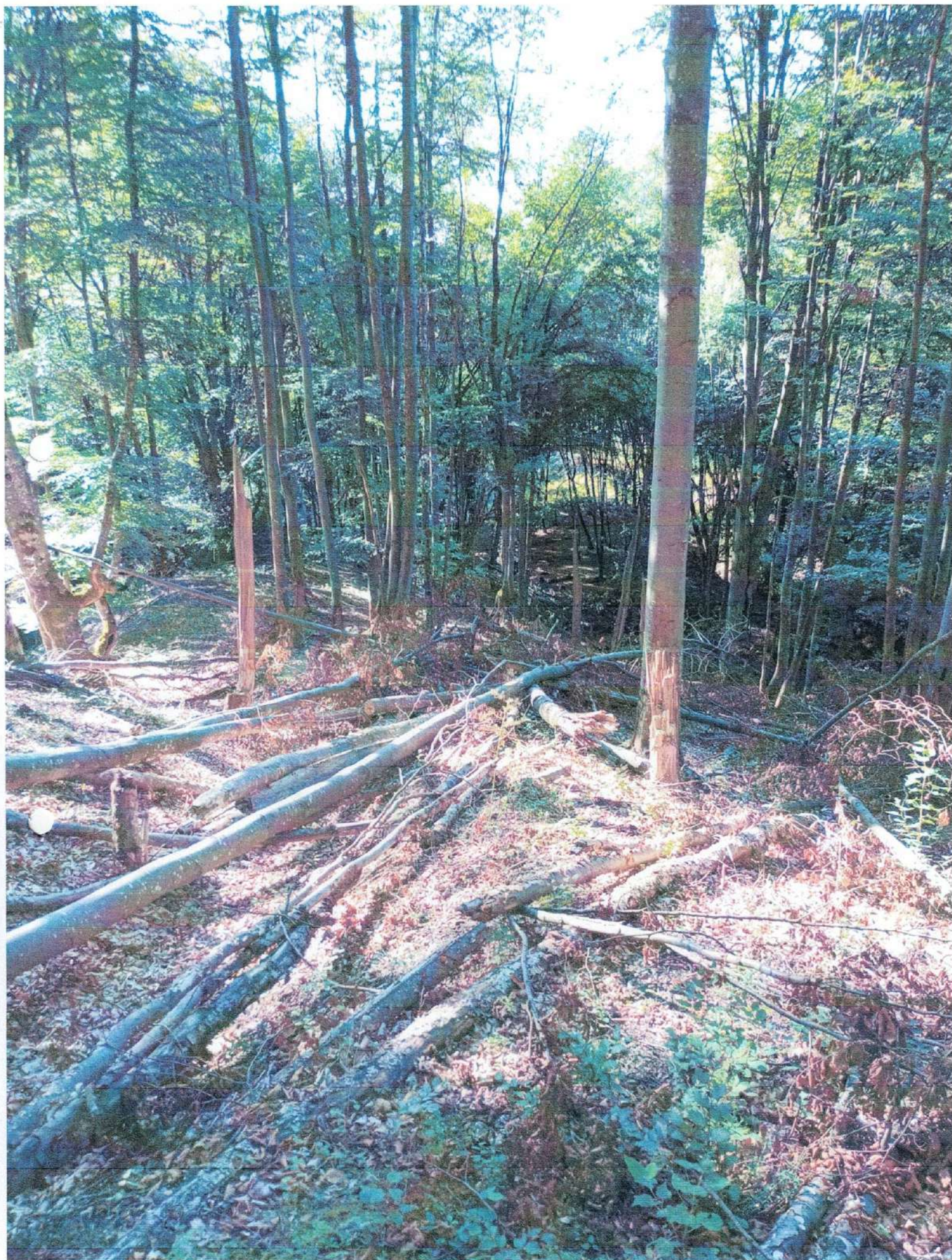
D.S. Muntolo Moro, OPI selokan no 83 B Tm Bela (Lander cursting Protona)