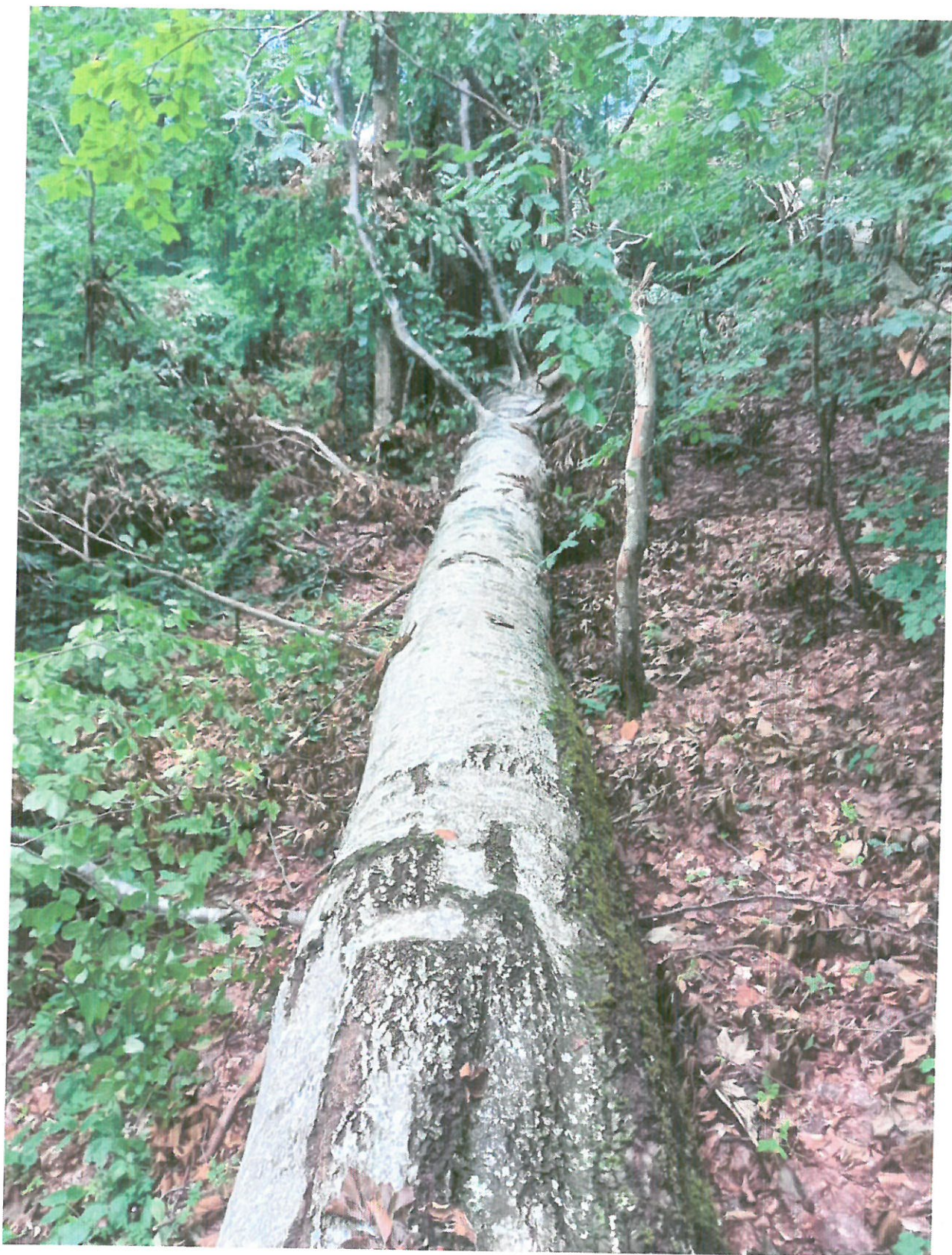
UP IV, Ua 57