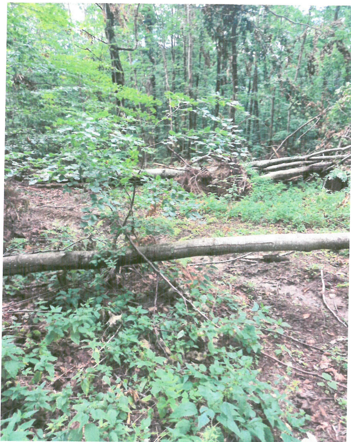
UP IV, Ua 57