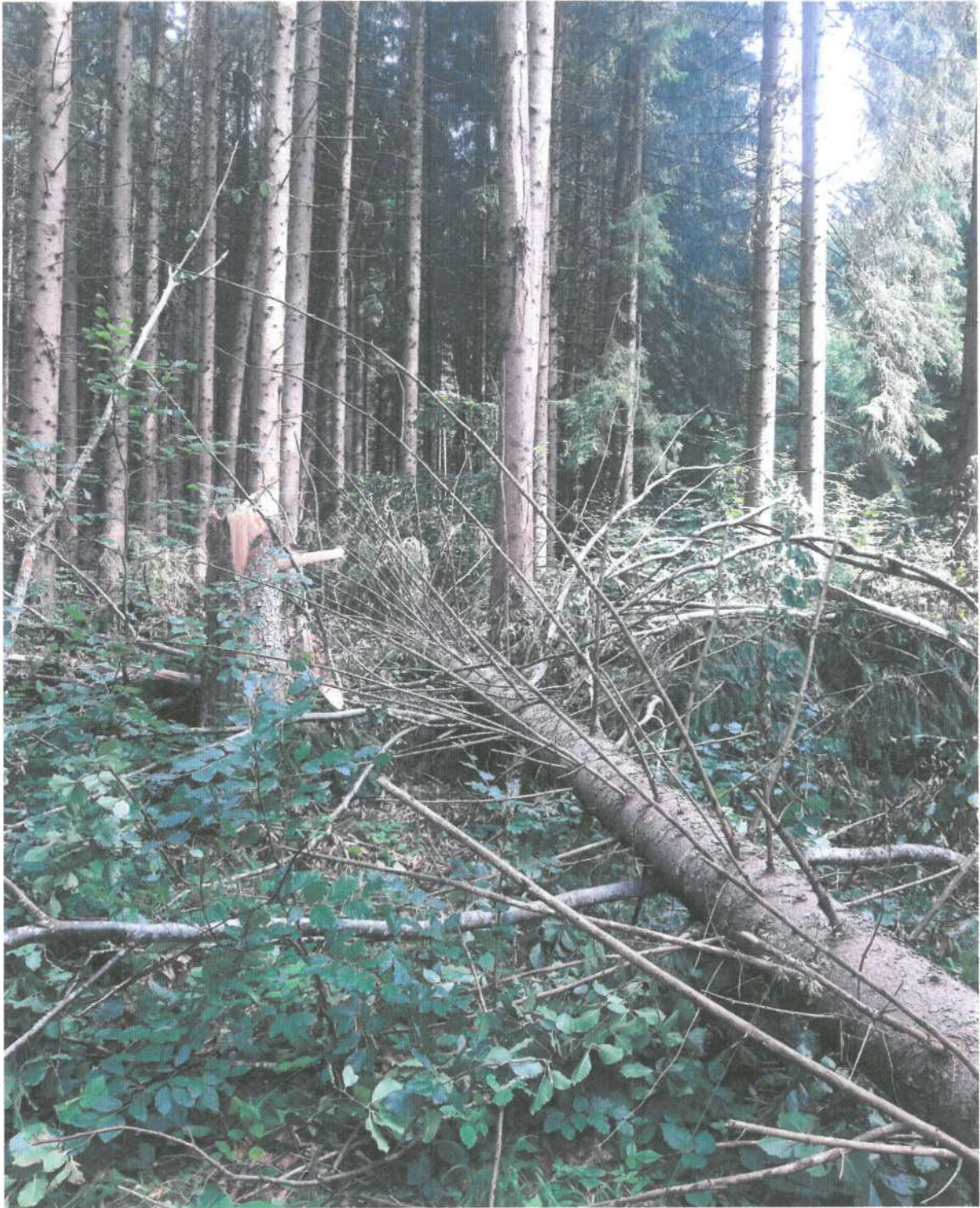
UP IV, Ua 43B