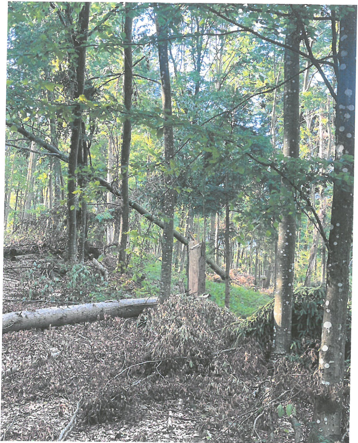
UP III, Ua 88