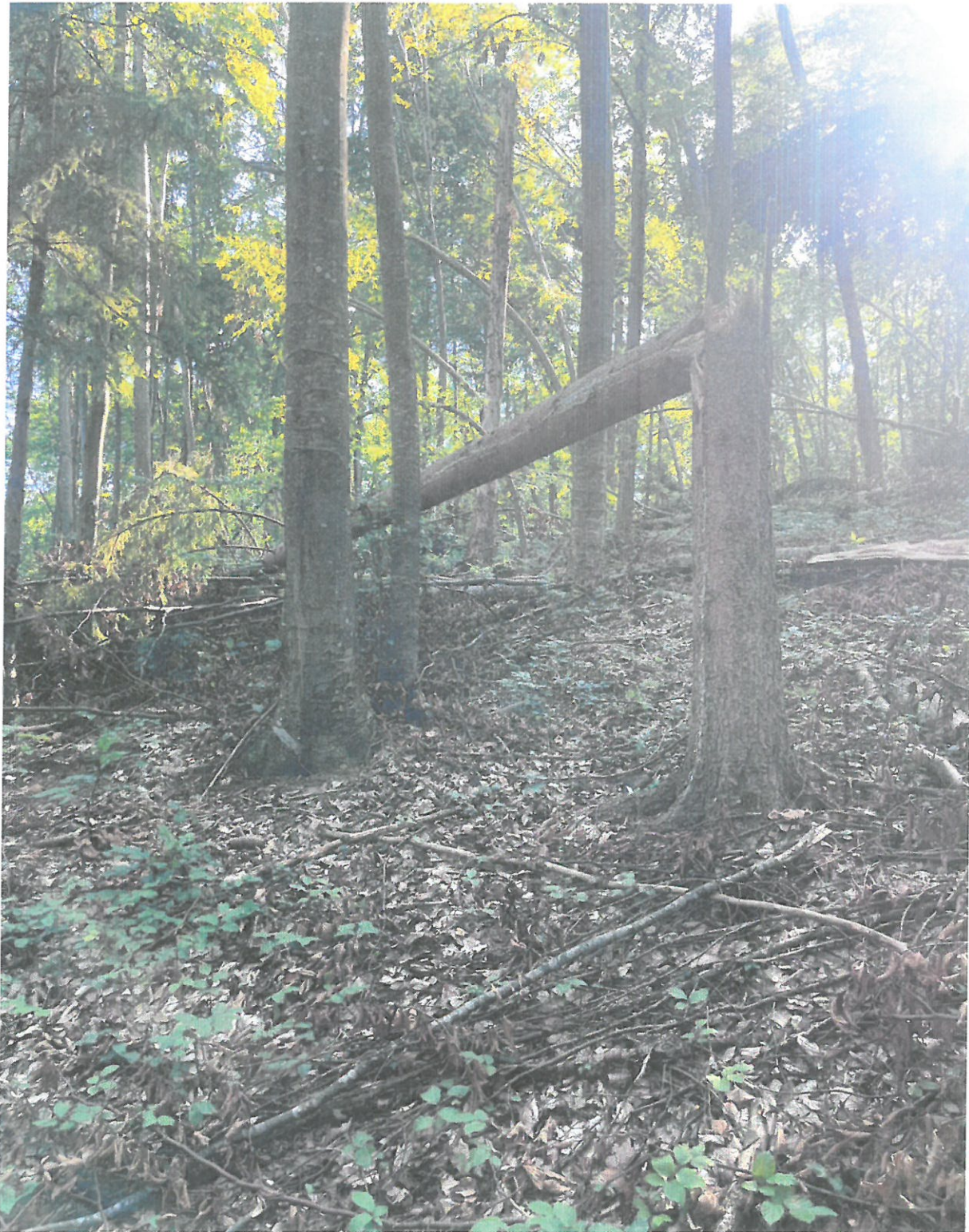
UP III, Ua 88