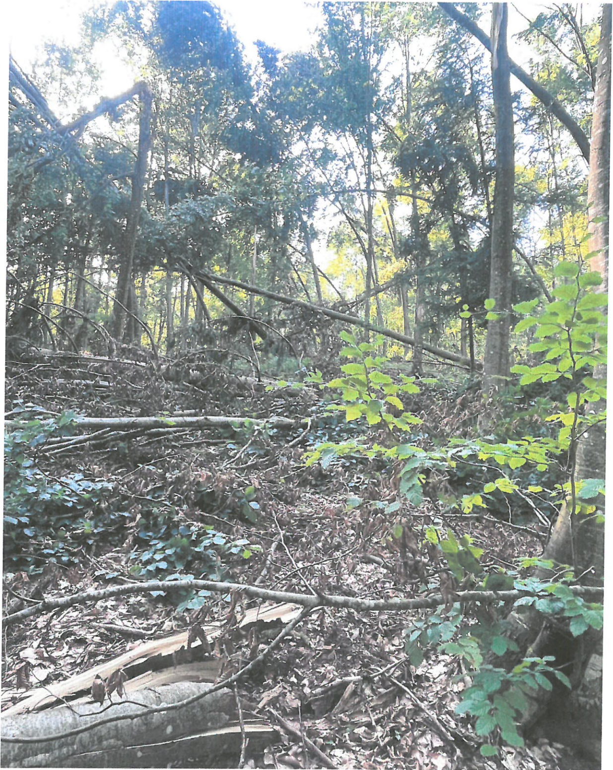
UP III, Ua 88