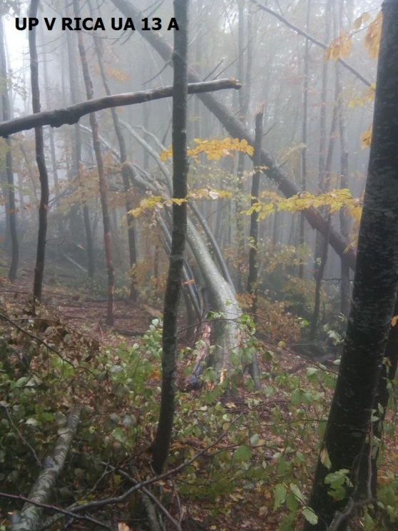
UP V RICA UA 13 A