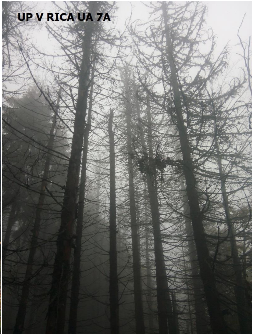
UP V RICA UA 7A