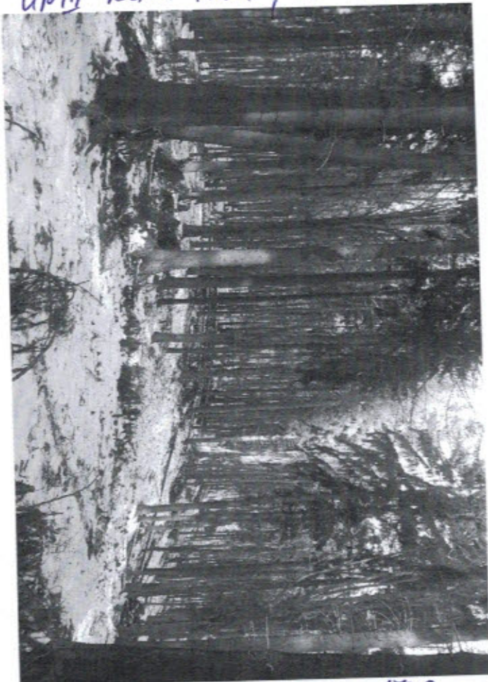
UP III Râul Mare UA 173 B