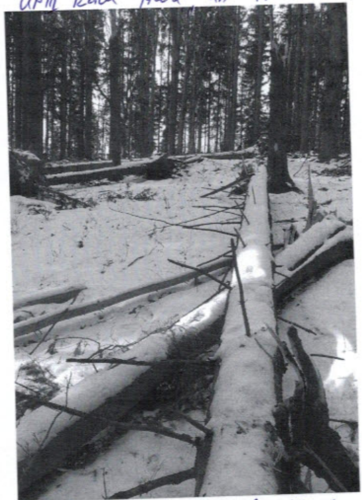
UP III Râul Mare; UA 173 B