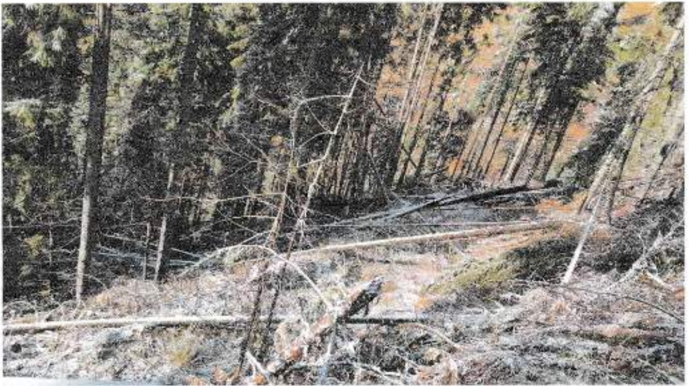
O.S. SOMES-TIBLES, UP. A Rebrisoara, u.a. 978 10.11.2016