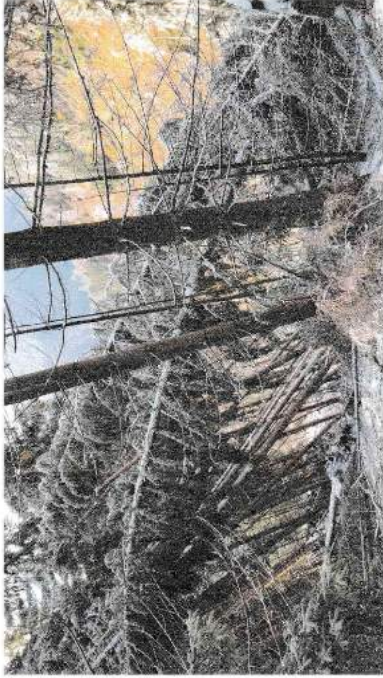
0.3. SOMES-TIBLES U.P. 1 Rebrisoara, u.a. 97 D 10.11.2016