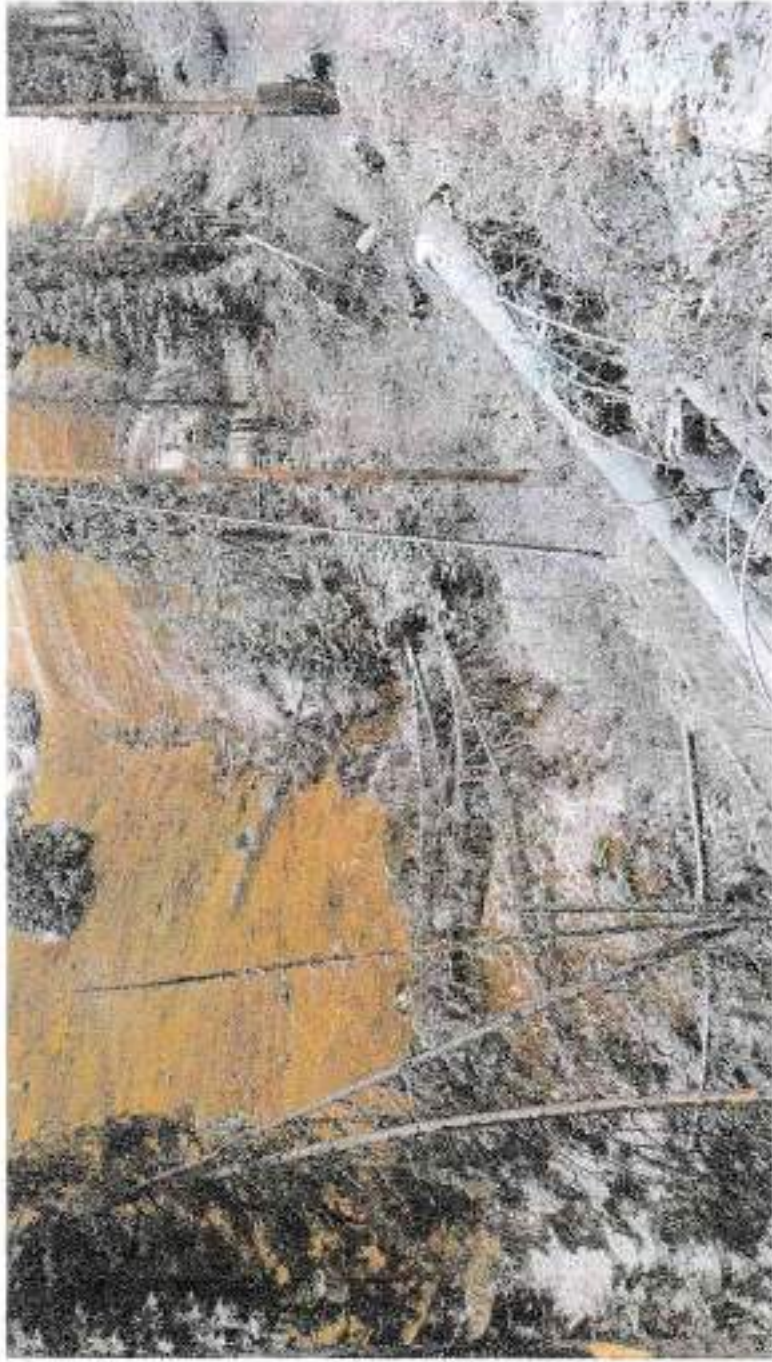
O.S. SOMEZ-TIBLES, U.P. & Rebrisoara, M.A. 37C 10.11.2016