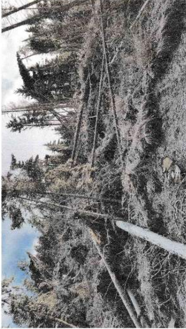
O.S. SOMEŞ -TIBLES U.P. A Rebrisoara, u.o. 97 D 10.11.2016