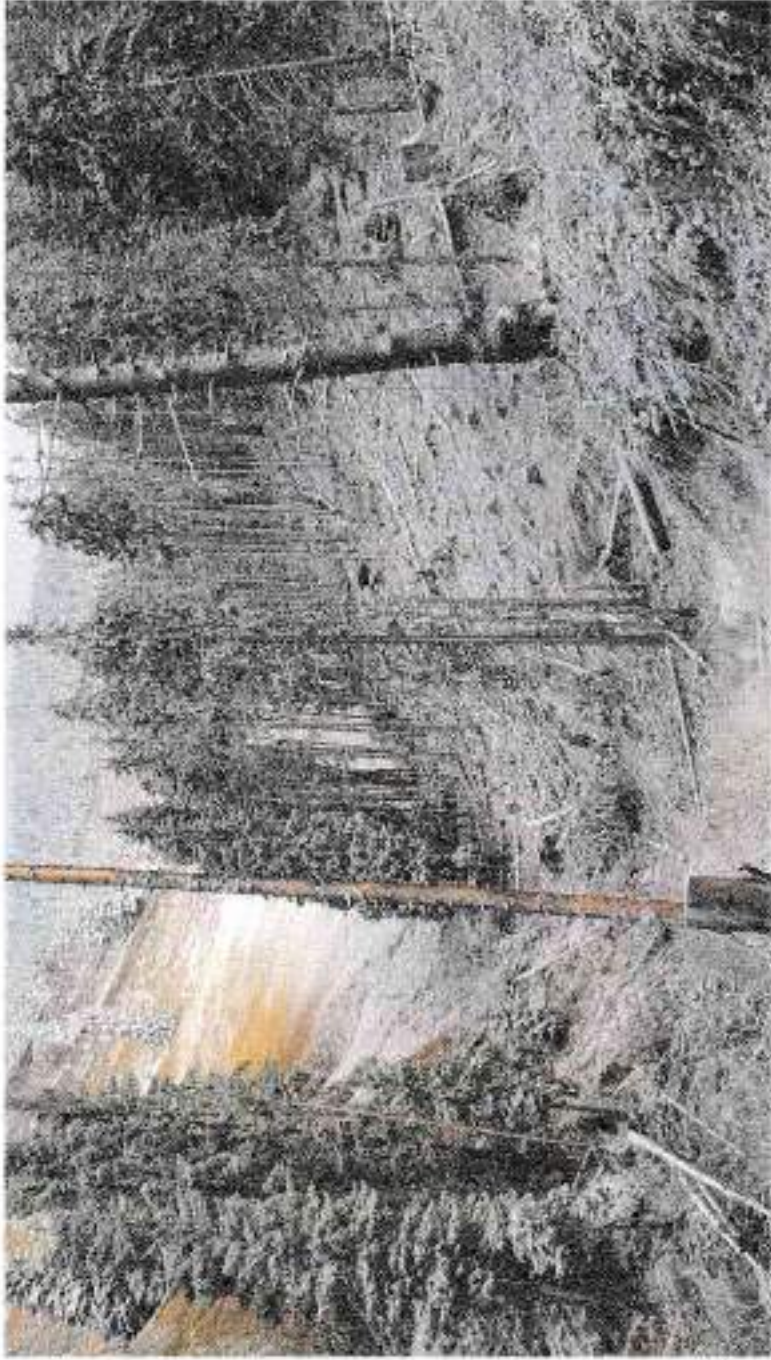
0.2 SOMES-TIBLES, U.P. L. REHISOARA, U.A. 97 D 10.11.2016