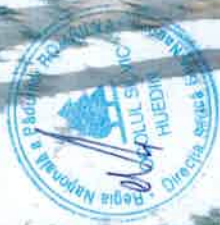
OCOLUL SILVIC HUEDIN / U. 13.1 Primăria Săcuieni / u.a. 86E / 6,5 ha / Primăria Săcuieni / 18.10.2016