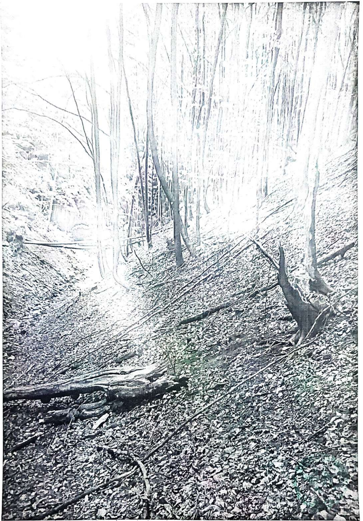
Fotografie realizată de pad BUSNICLAIE, în UPI PARVA, nr 154 OCTOMBRIE 2023