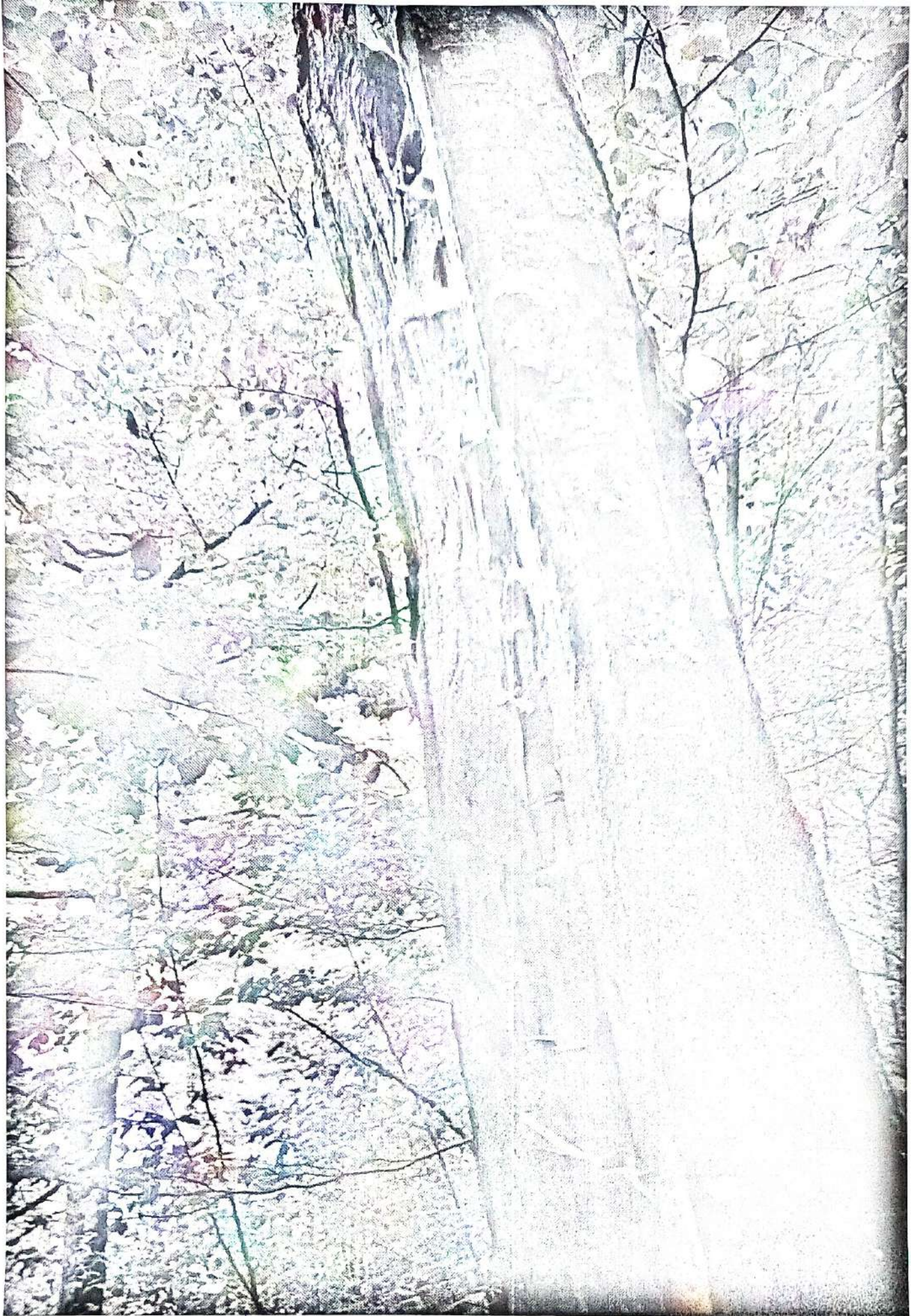
în UP I Parva, wa 142, octombrie 2023