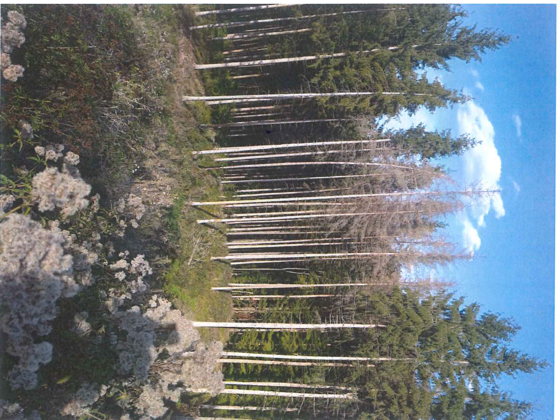
UP IV. Unguras u.a. 13C