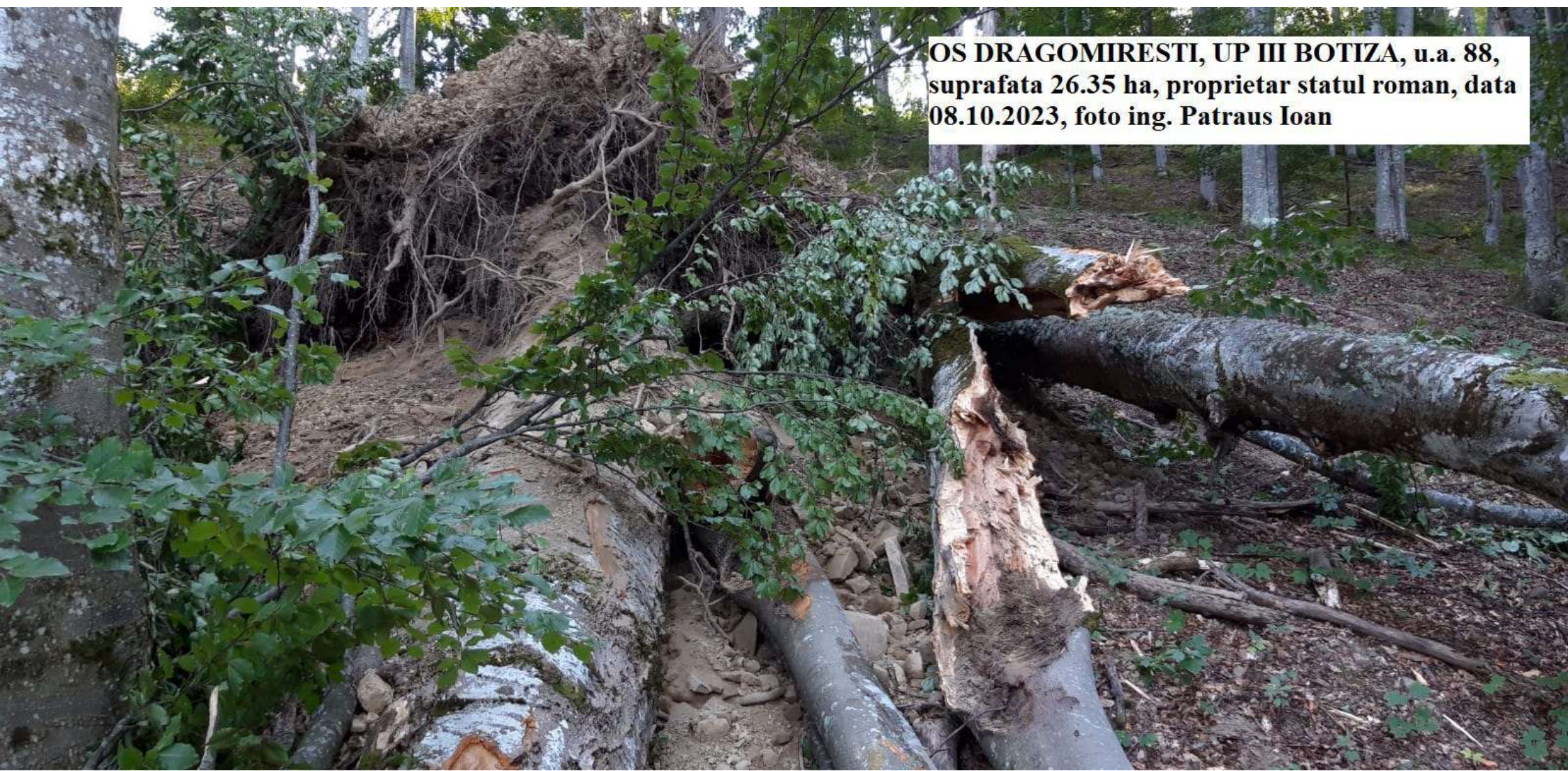
OS DRAGOMIRESTI, UP III BOTIZA, u.a. 88, suprafata 26.35 ha, proprietar statul roman, data 08.10.2023