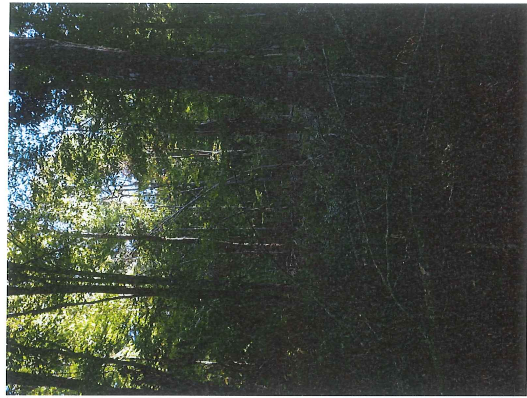
U.P. I. DEJ-MICA u.a 6F