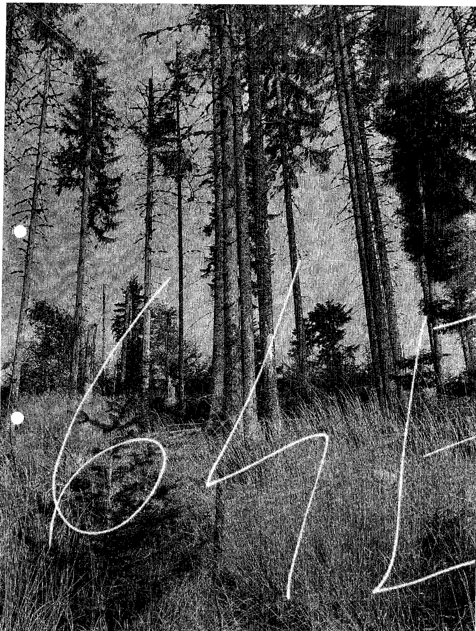
U. P. I BIRDA DESUS UO 64E