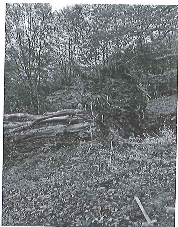
U.P. I, ua 93E