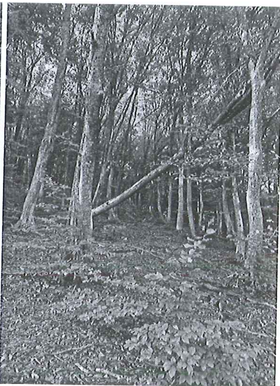
ua 93E