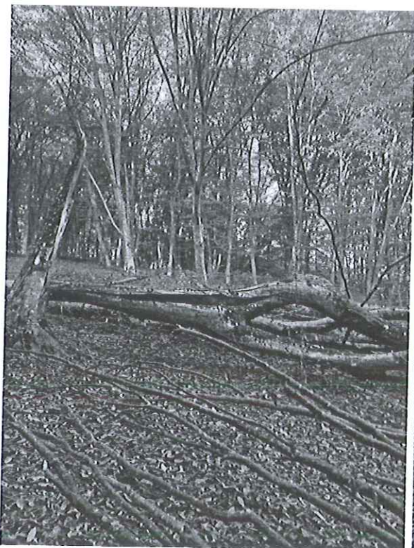
U.P. I, ua 93E