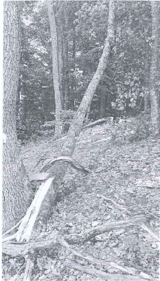
UP II Gherla, ua 55B, 08.08.23