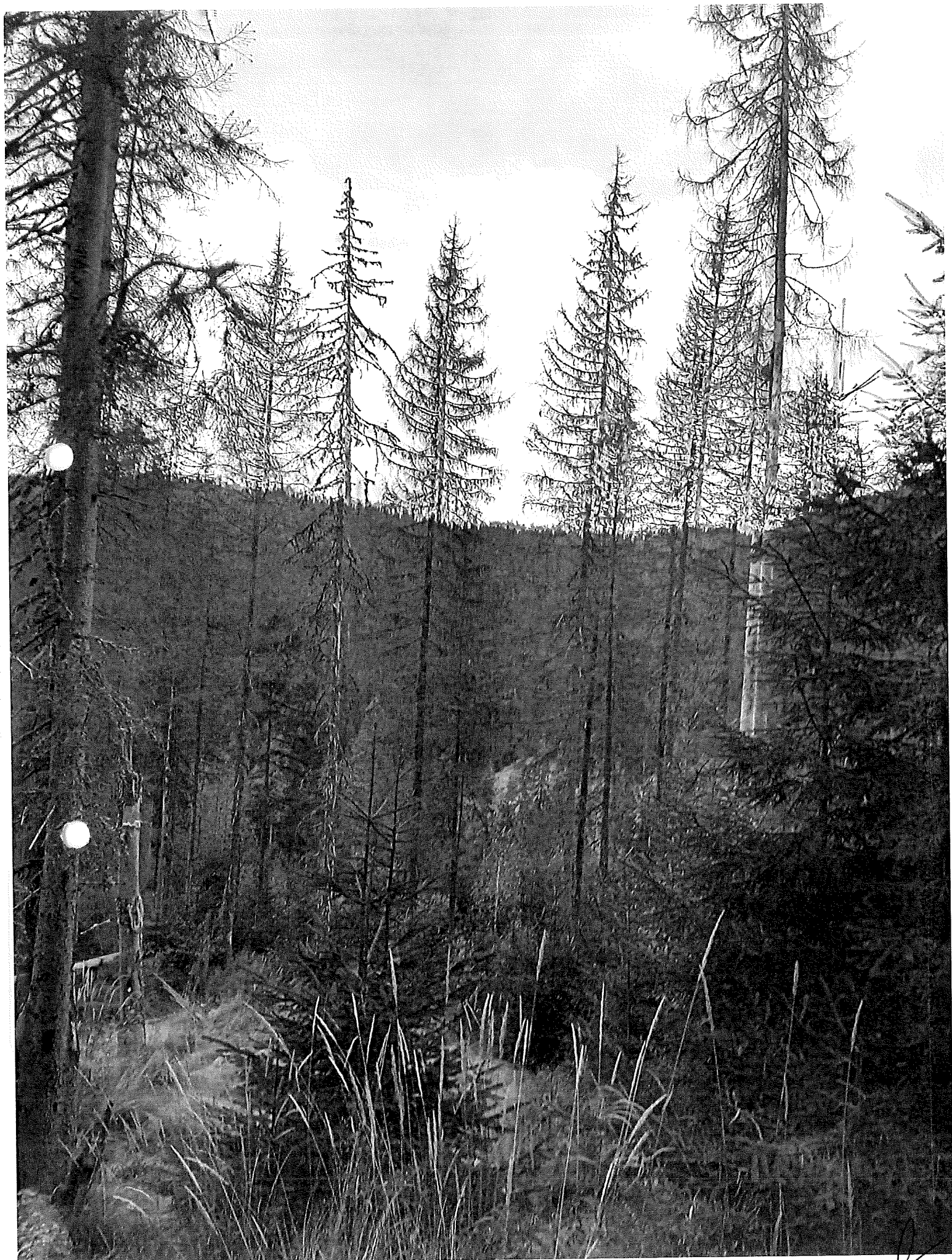
У. Д. I ПОСТАМА НОРГА; У. Д. 43С;