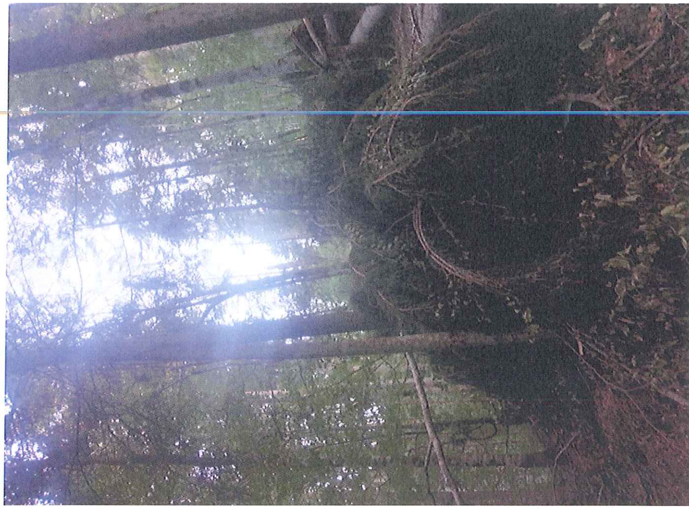
arbori doborzati de vânt LP IX u-a 220A, B.