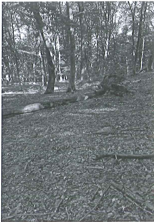
U.P. I Convenția Vultureni, ua 95B