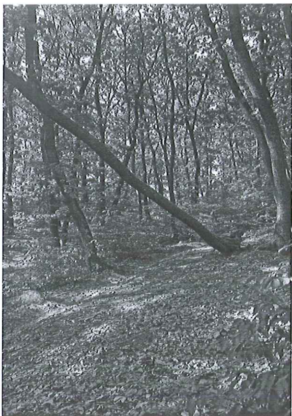
U.P. I Convenția Vultureni, ua 95B