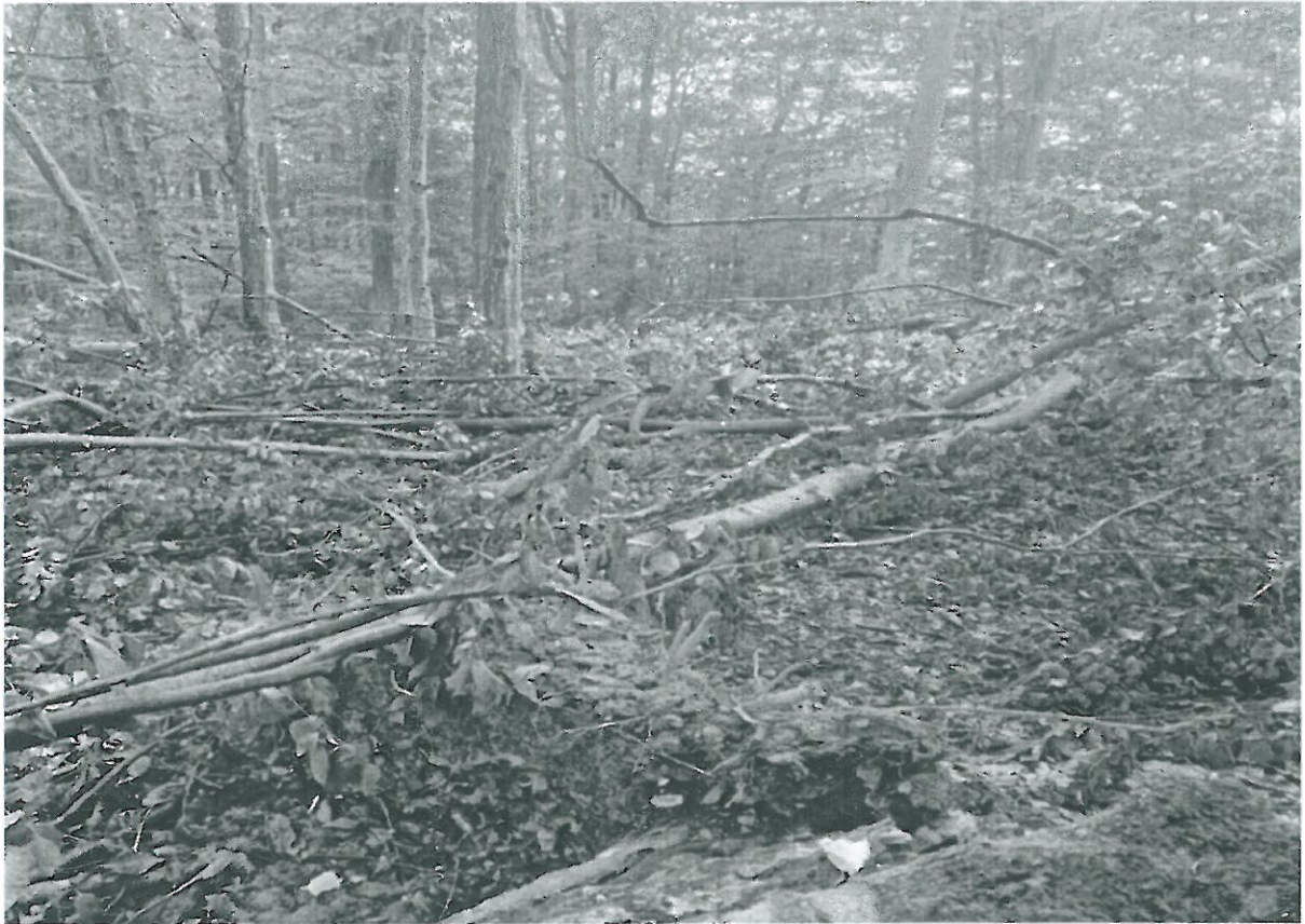
U.P. I Bojesti u.a 91A