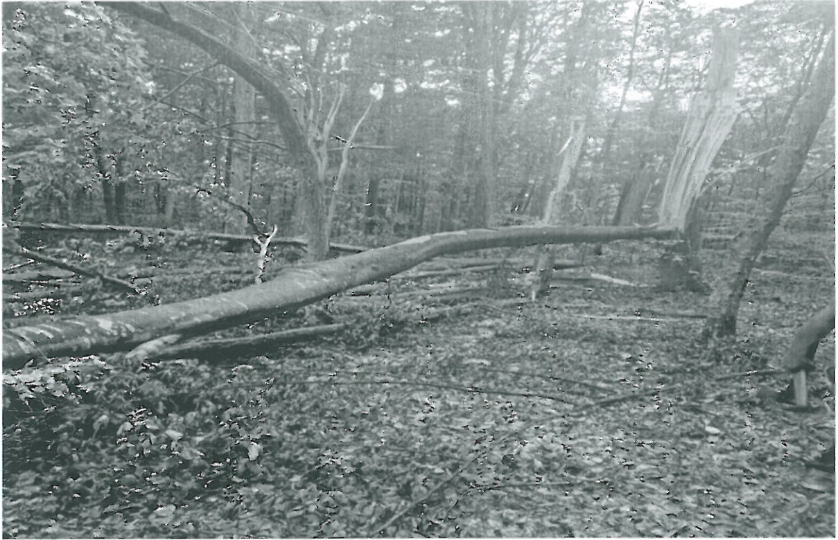
U.P. I Bojesti u.a 90A