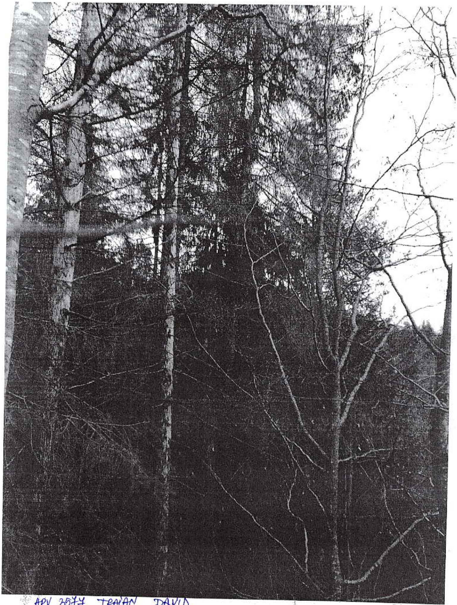
APV 3574 TRAIN DAVID