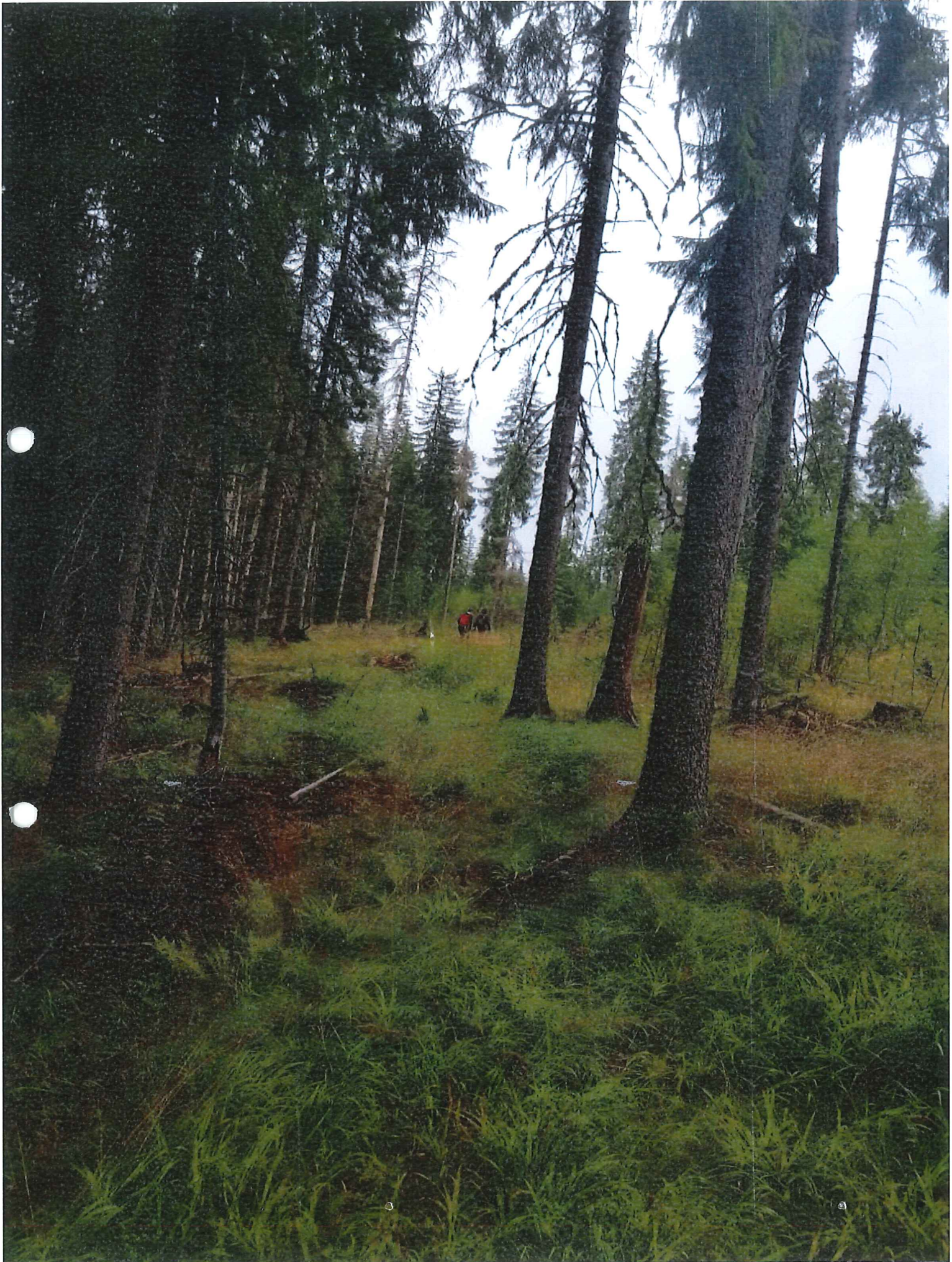
Teh. Maltš; Carnel U.P.I. Polano. Florea; u.a. 17 B APX