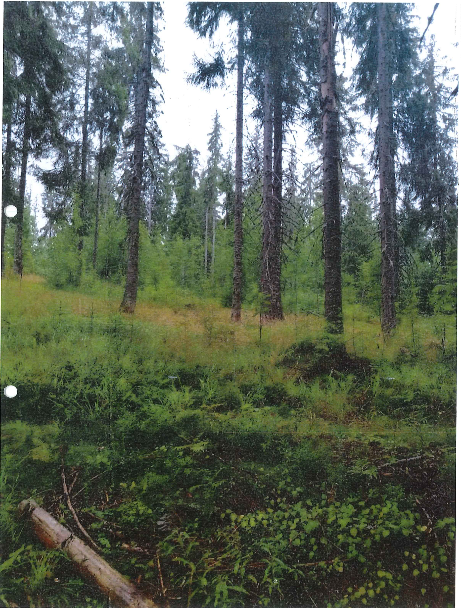
Teh. Martin Cornel U.P. I Psiara Horea ; u.d. 18 B. 18