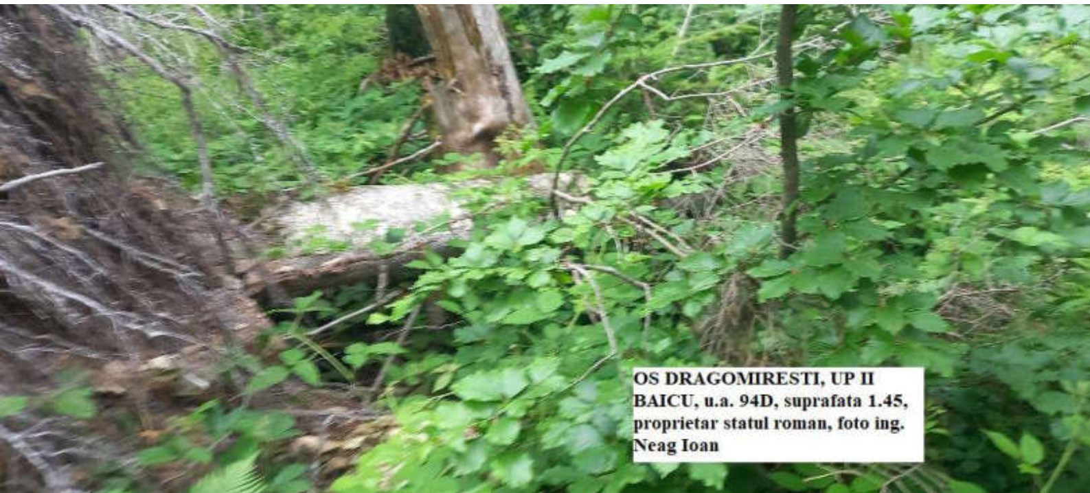
OS DRAGOMIRESTI, UP II BAICU, u.a. 94D, suprafata 1.45, proprietar statul roman