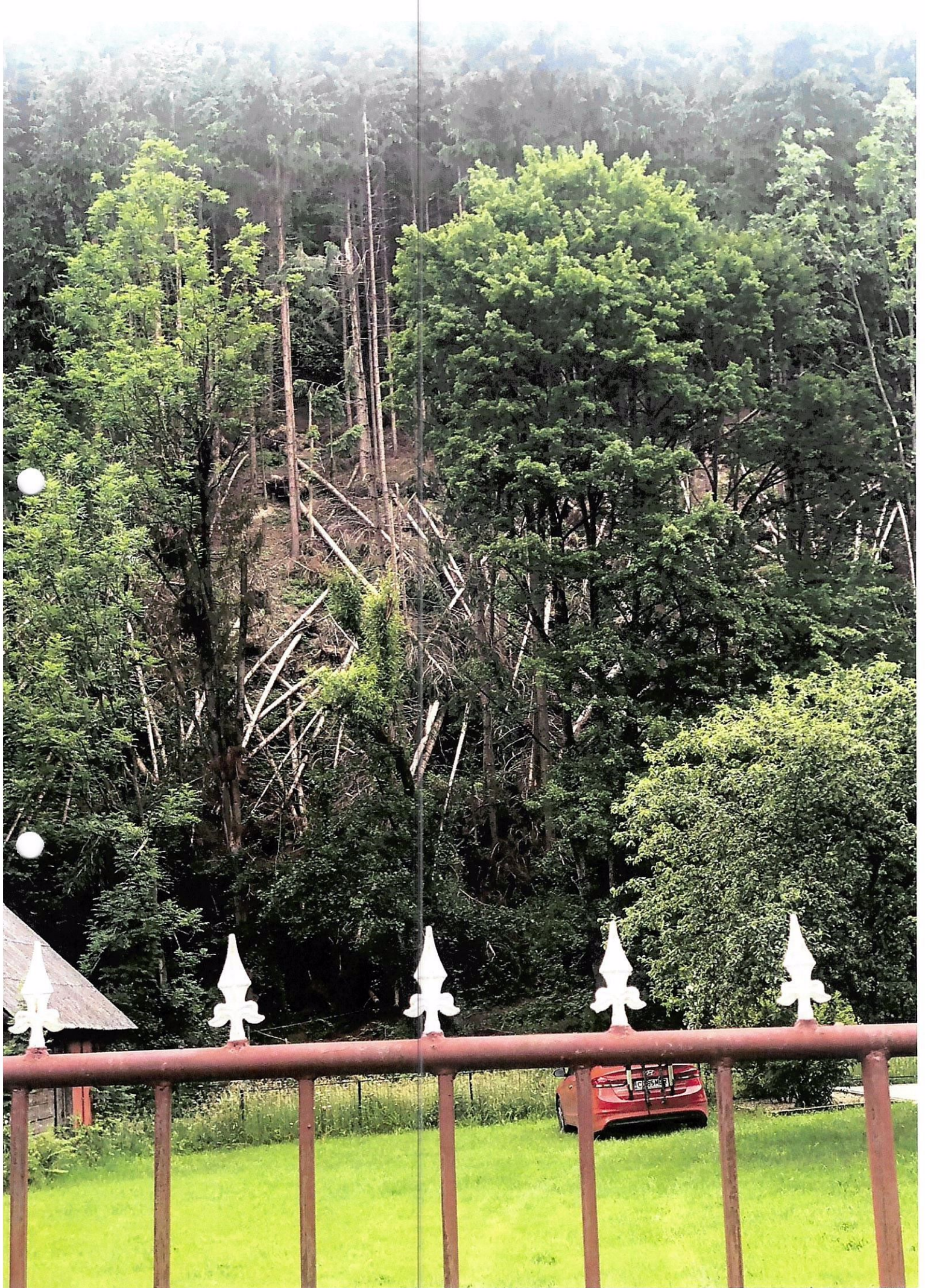
IIP IV BISTRĂ u.a. 1 - MERA CĂTĂLIM-RAU fd