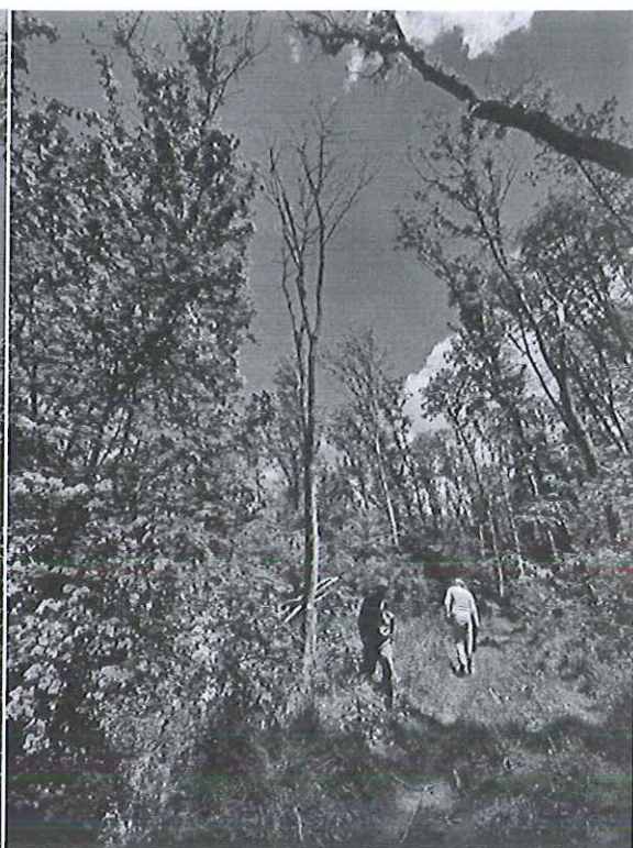
UP XI Gherla, ua 96A, 19.05.2023