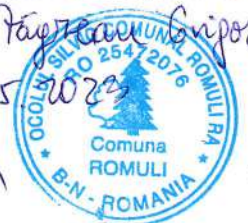
Data: 25.05.2023 Myn

Ocolul Săbuc Comunei Romuli RA. VPI Romuli, ua 134A. Proprietar: comuna Romuli, sus Bistrita-Năsăud