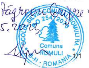
Data: 25.05.2023

Oedul sohic Comercial Romuli RA VPI Romuli, ca 128C Proprietar: comuna Romuli, sus. Borata-Narand