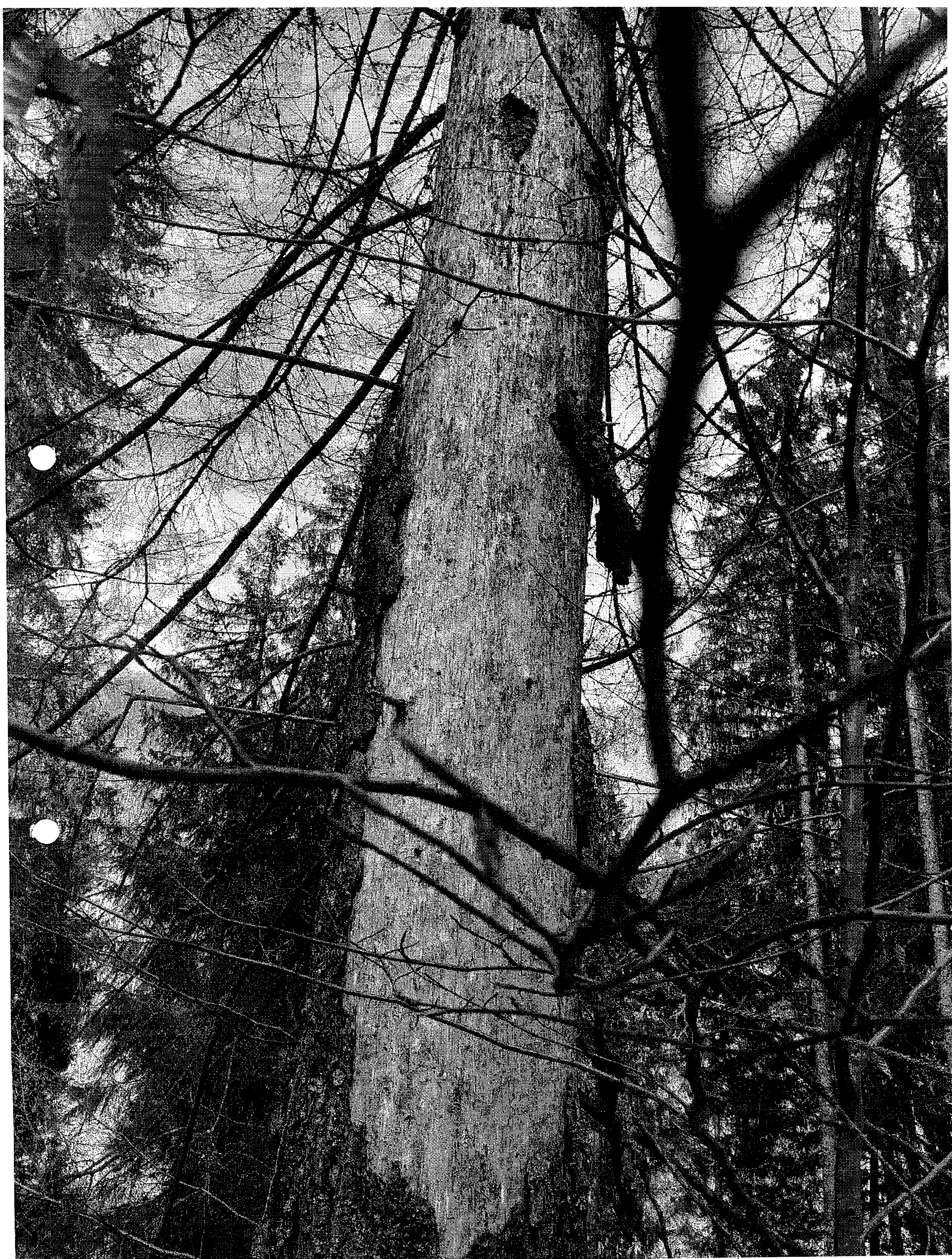
sof. Leakey Trench at post. China Pavilion