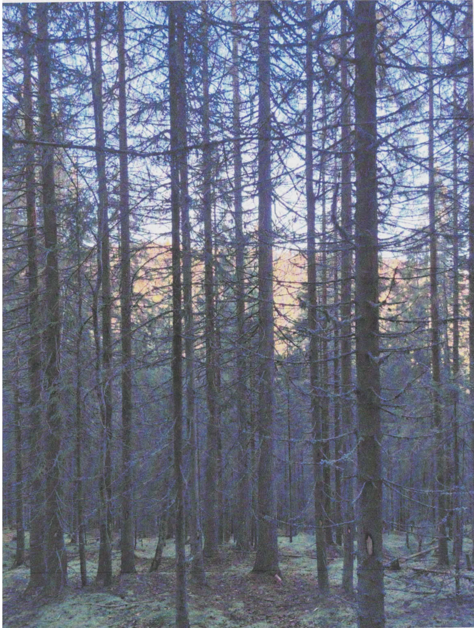
UPI Aires Mae ua 57A