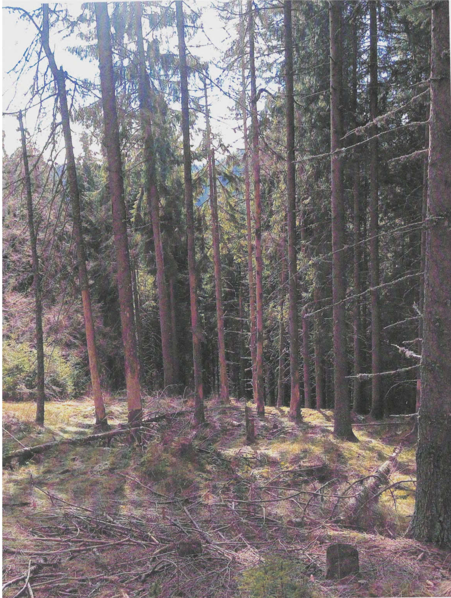
UPI Aries Mare ua 64B