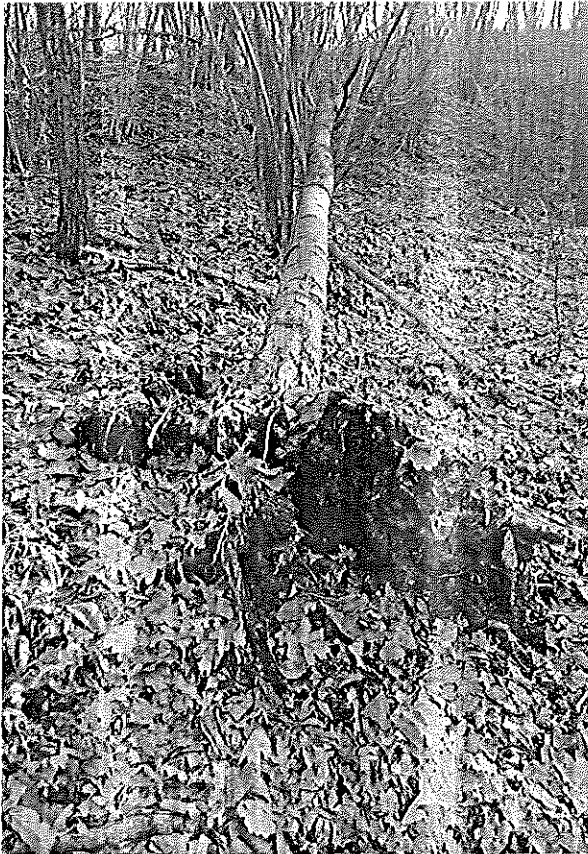
UP XII Sântejude, ua 179B, 18.02.2023