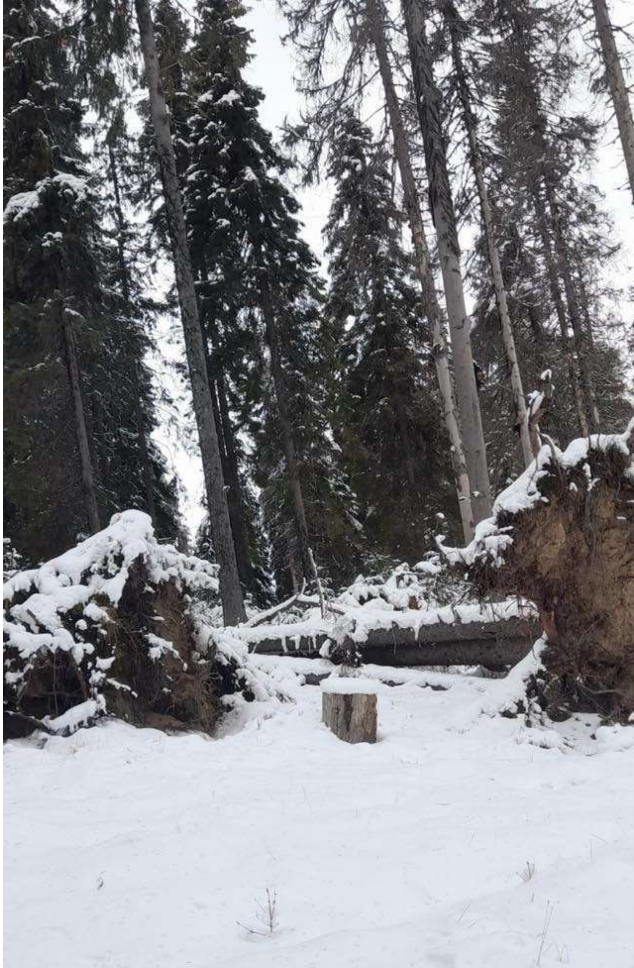
UP II Ciocadia u.a 42 A