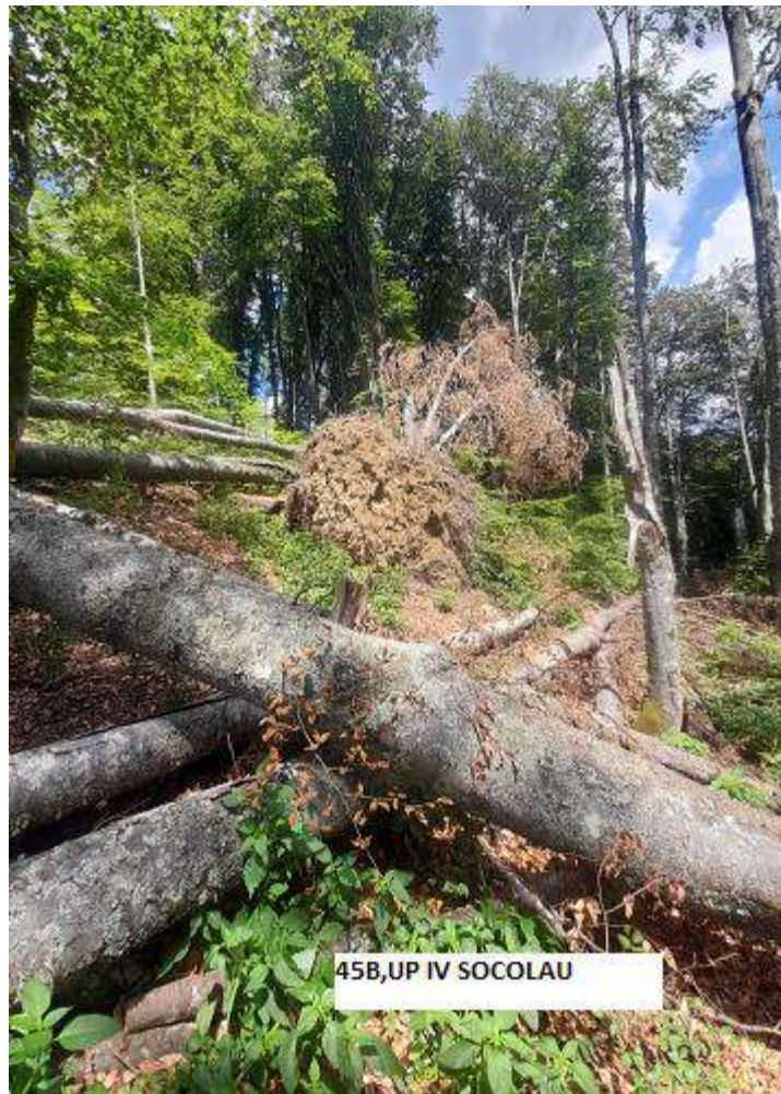
45B,UP IV SOCOLAU