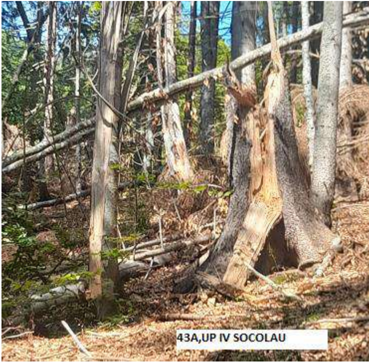
43A,UP IV SOCOLAU