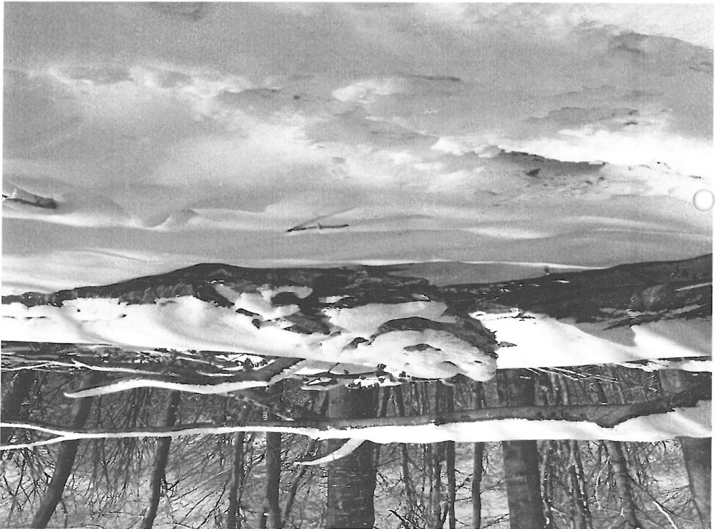
U.P. II ASUNT u.a. 26 B