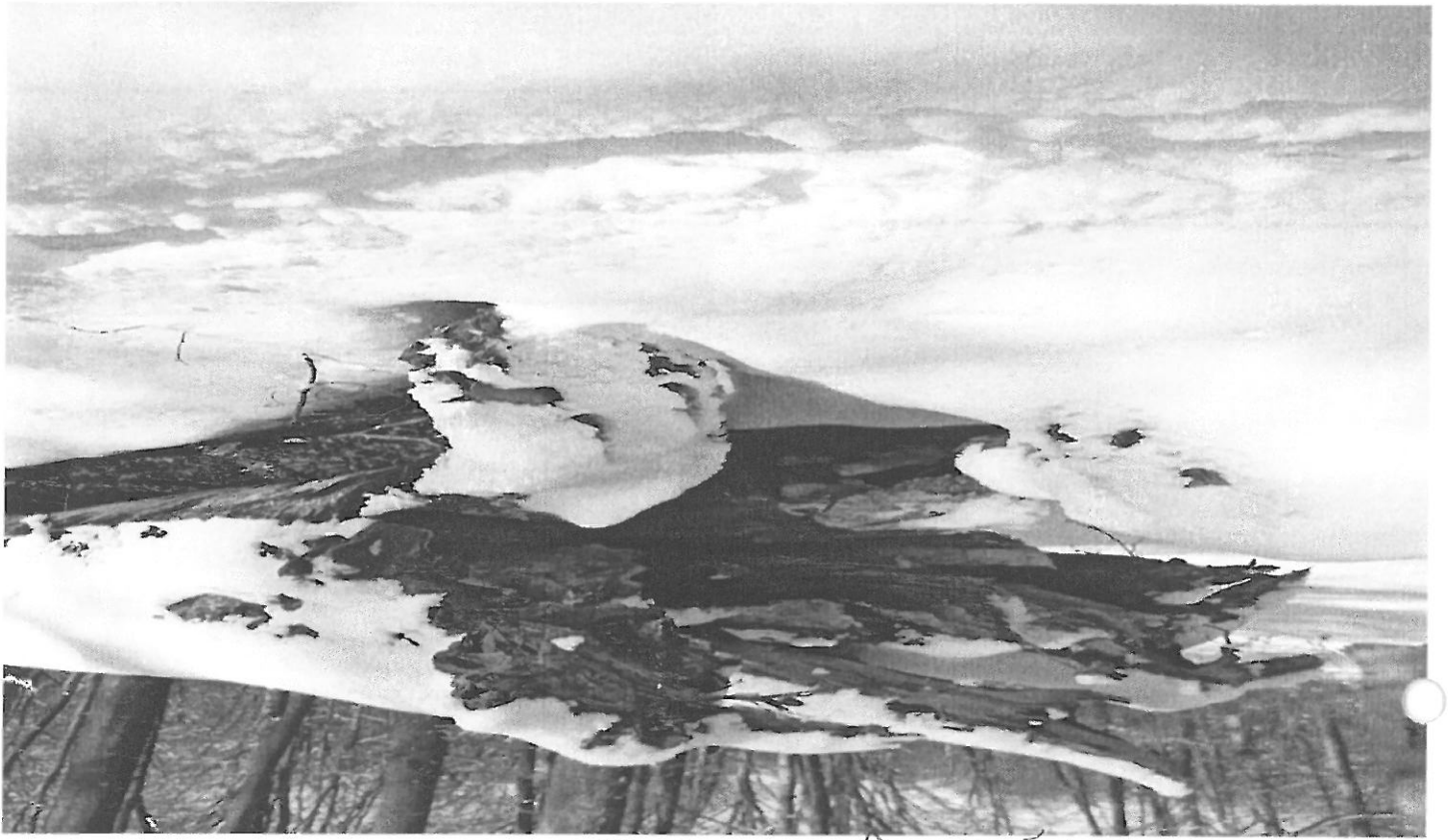
U.P. II ASUNT u.a. 31 B