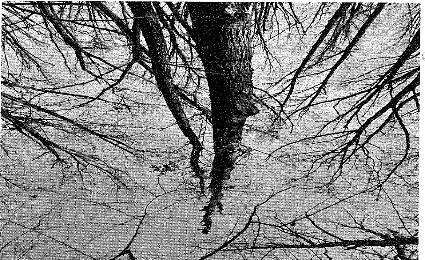
U.P. Il Assocere Ulmeni u.a. 216 B