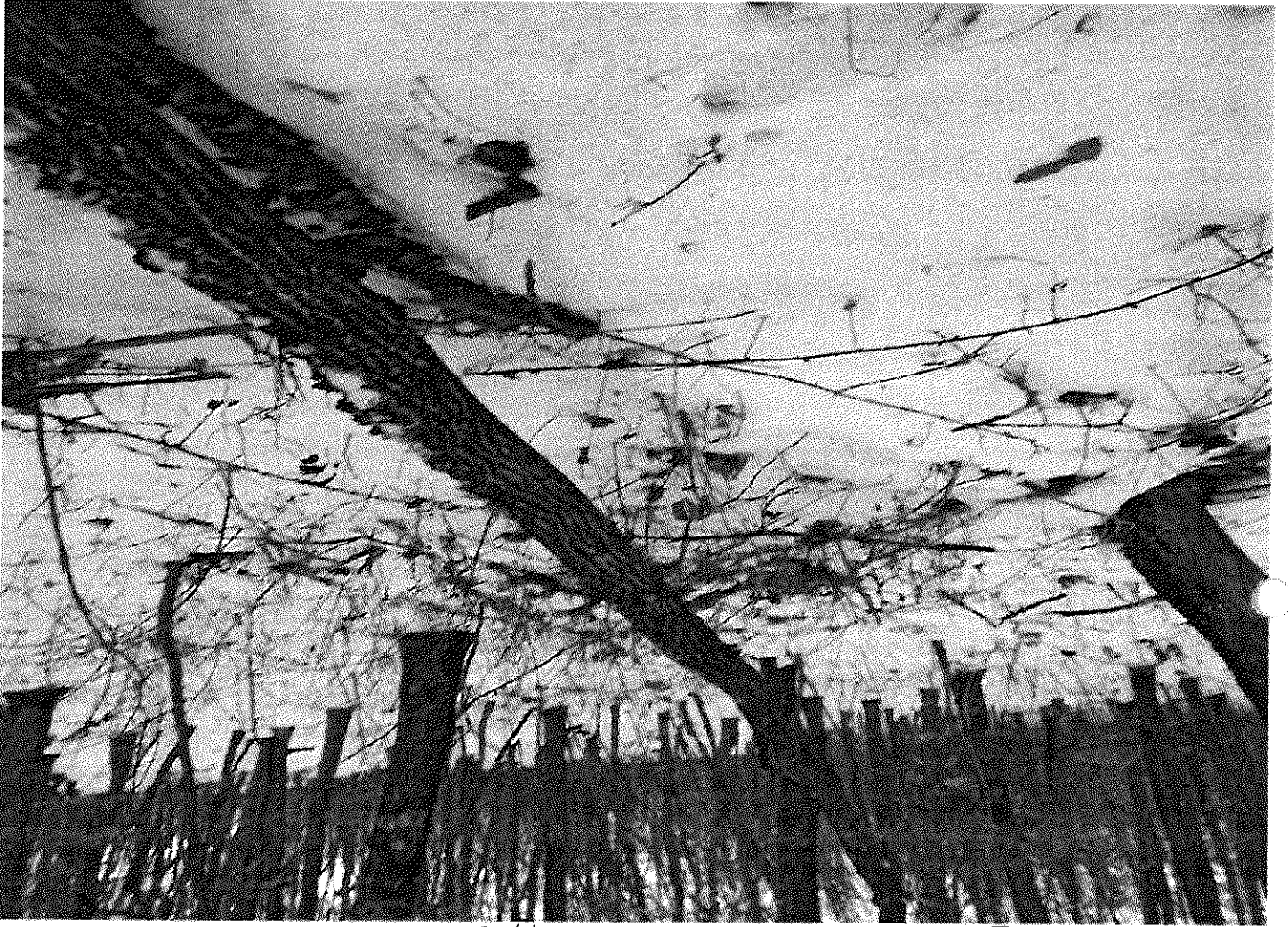
U.P. Il Assocere Ulmeni u.a. 217 B