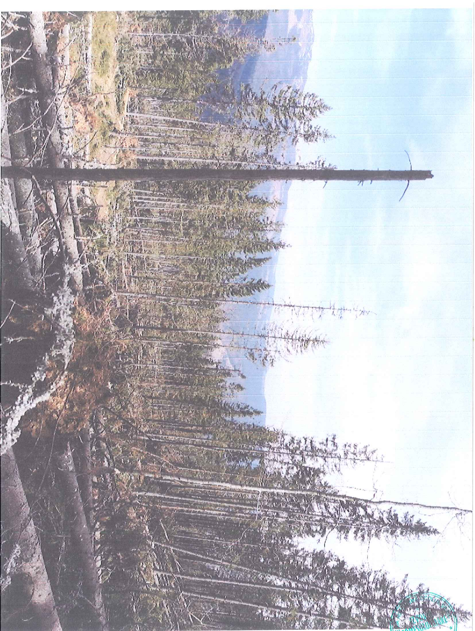
în data de 11.05.2020 în UPI Poiana Mare nr. 30