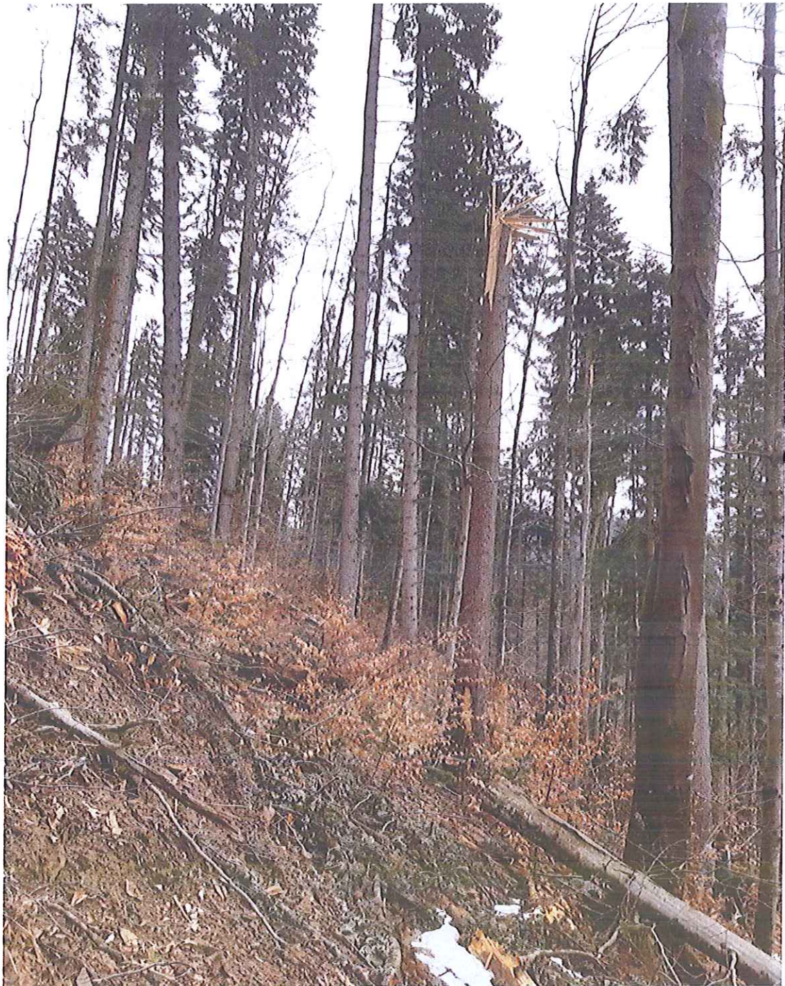
ARBORE RUPT DE VANT UP IX VALEA MARE CÂRTIBAV U.A. 34A