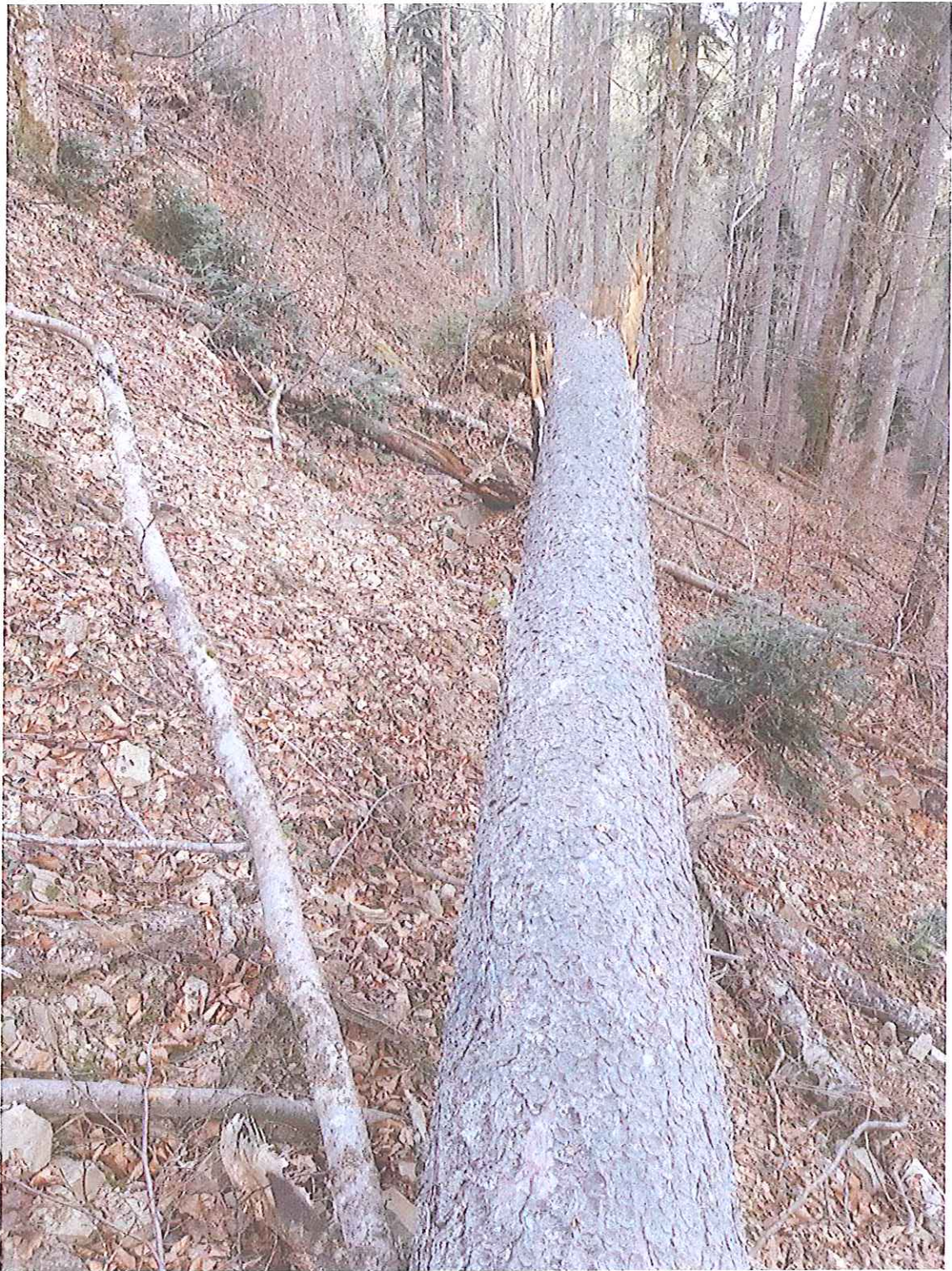
ARBORE RUPT DE VANT UP IX VALEA MARE CÂRTIBAV U.A. 35