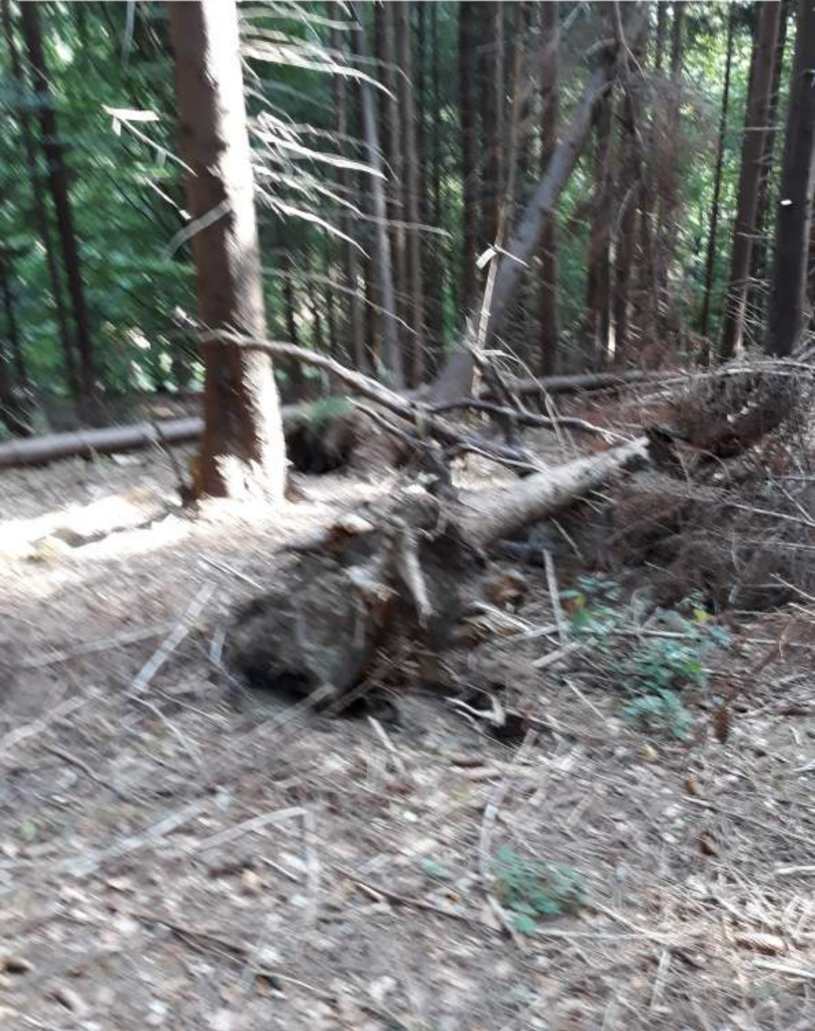
OS DRAGOMIREȘTI, UP II BAICU, u.a. 158E, suprafața 2.80 ha, proprietar -statul român, data fotografiei 19.09.2019