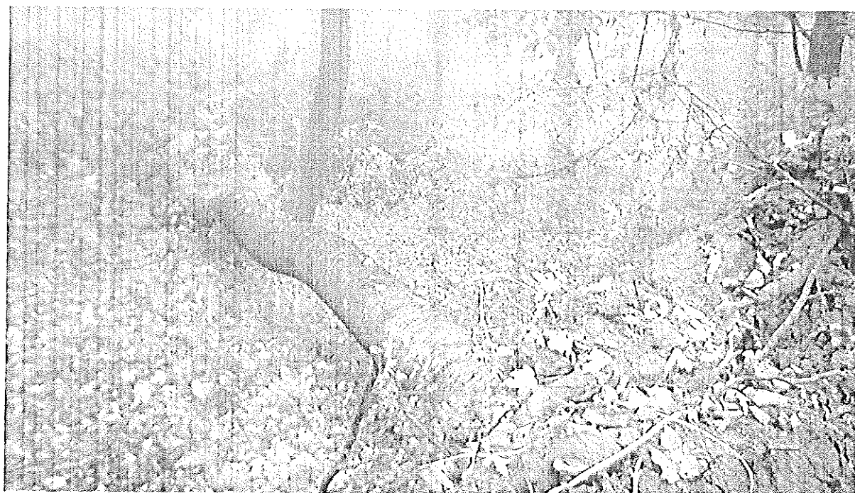
UP II, ua 82A, pădure proprietate de stat, S= 20,75 ha, 16.10.2017