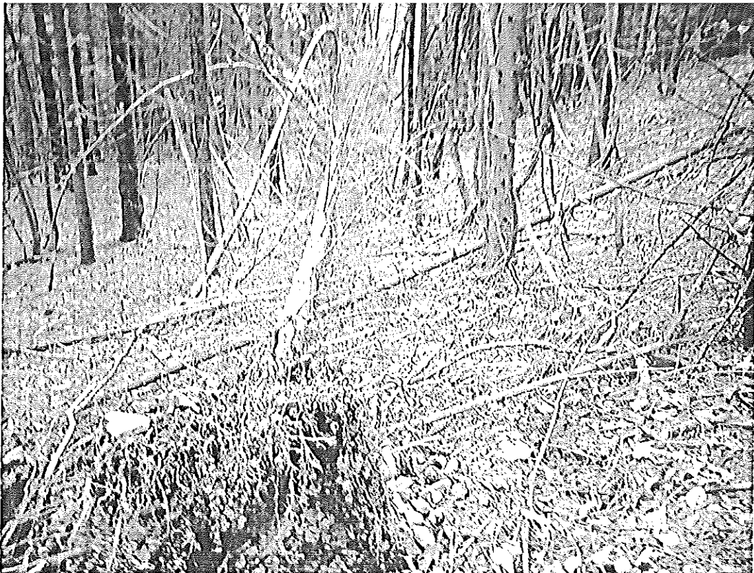
UP V Iclod, ua 4, pădure proprietate de stat, S=2,7ha, 10.10.2017