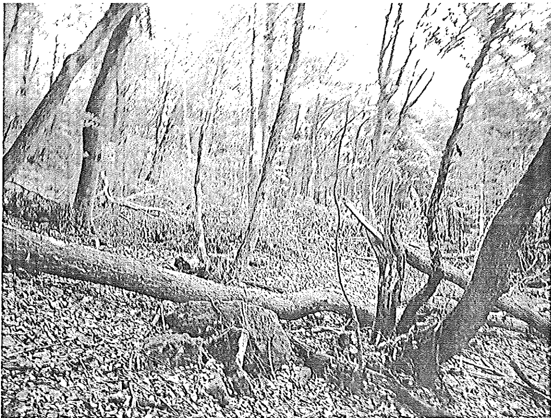
UP V Iclod, ua 52B, pădure proprietate de stat, S=2,27ha, 10.10.2017