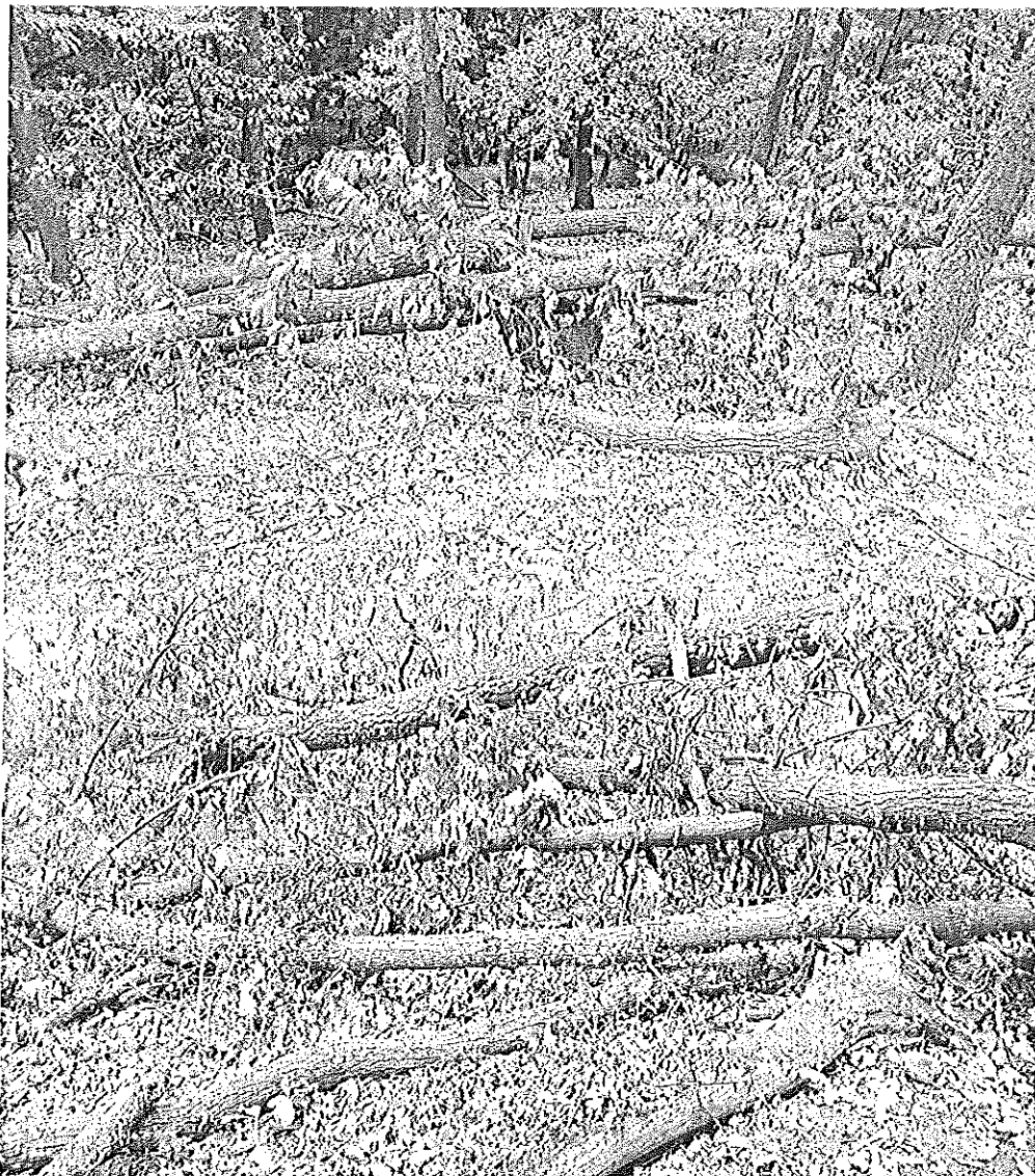
UP IV Panticeu, ua 103D, pădure proprietate de stat, S=8,51 ha, 23.10.2017