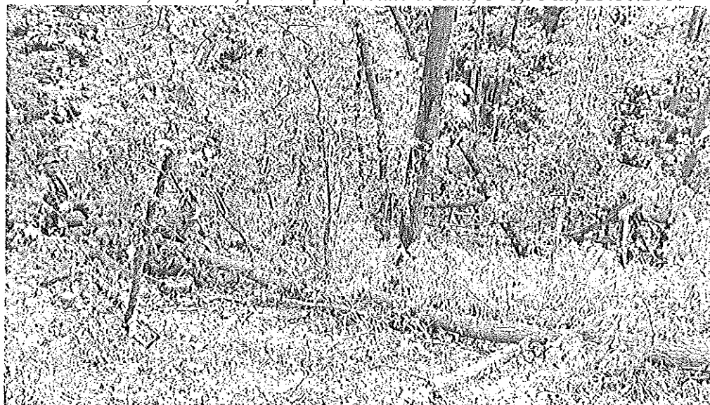
UP IV Panticeu, ua 102D, pădure proprietate de stat, S=1,73 ha, 23.10.2017