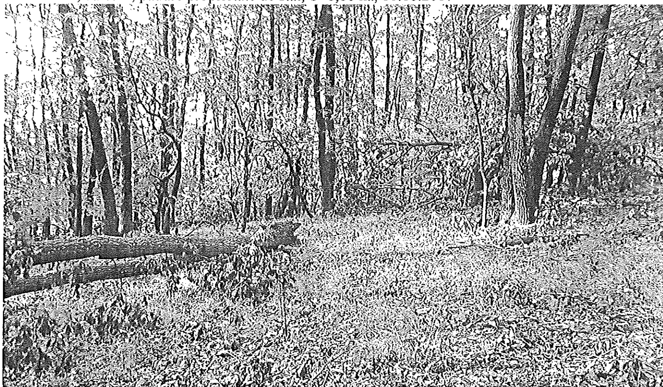
UP V Iclod, ua 86E, pădure proprietate de stat, S=1,96 ha, 11.10.2017