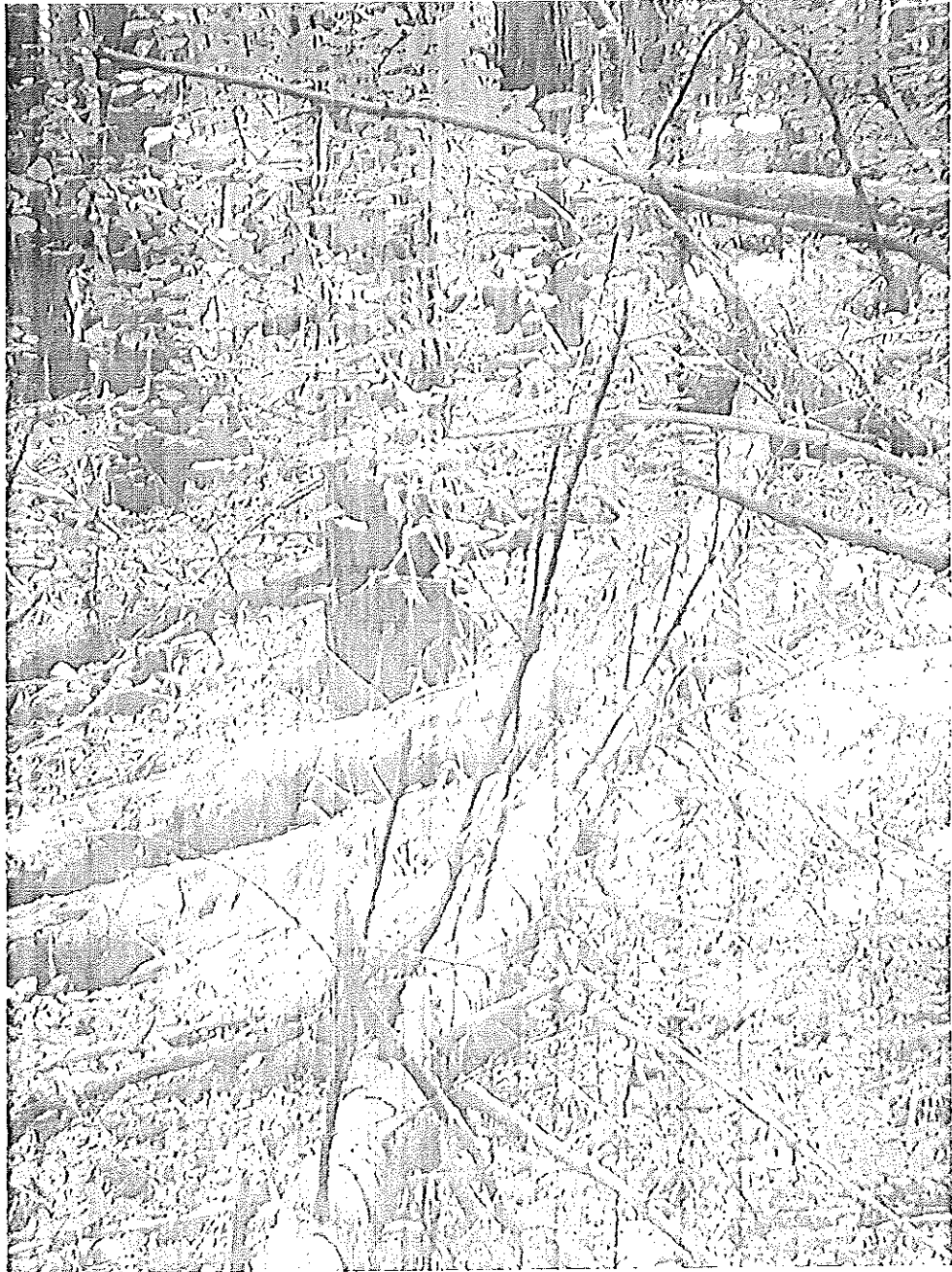
UP I Țaga, ua 120. S=18.20 ha. pădure proprietate de stat. 10.10.2017