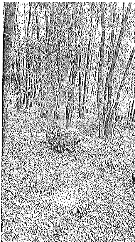
UP I Țaga, ua 10, S=2,34 ha, respectiv 20D, S=3,7 ha; pădure proprietate de stat, 12.10.2017