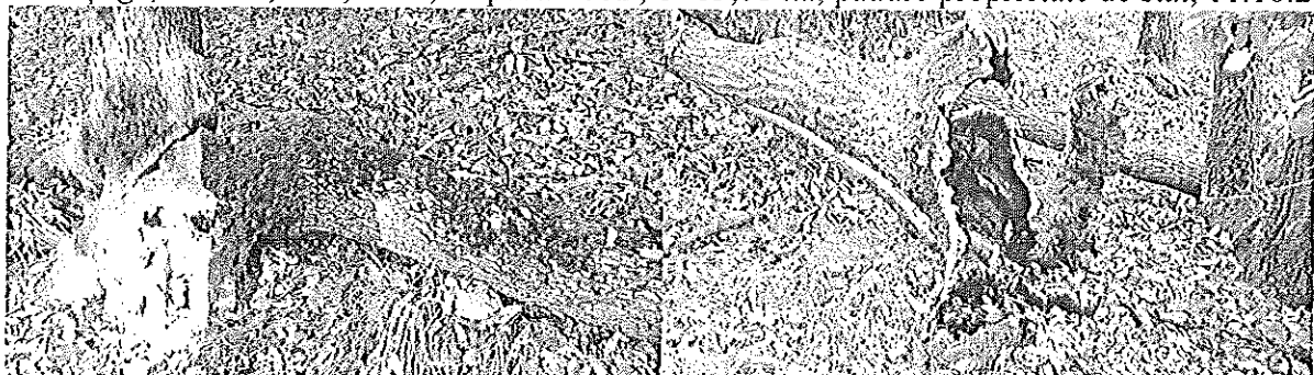
UP I Țaga, ua 23A, S=4,95 ha, respectiv 24B, S=8,03 ha; pădure proprietate de stat, 11.10.2017