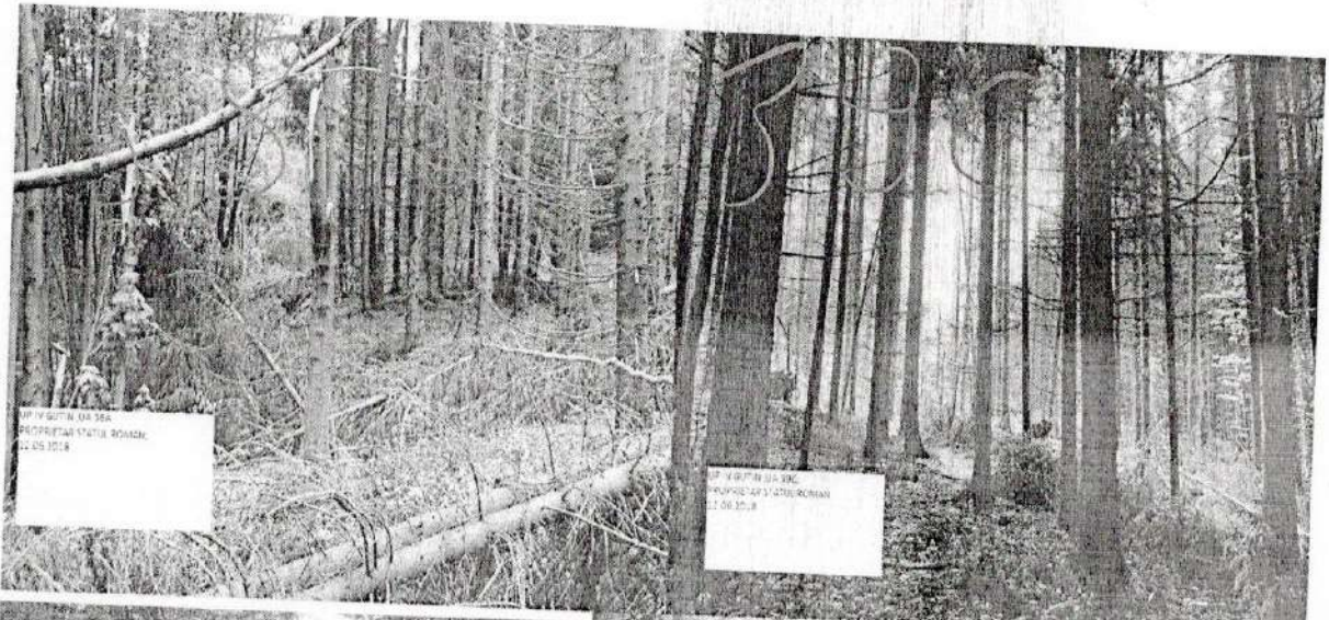
UP IV GUTIN UA 36A PROPIETAR STATUL ROMAN 12.06.2018