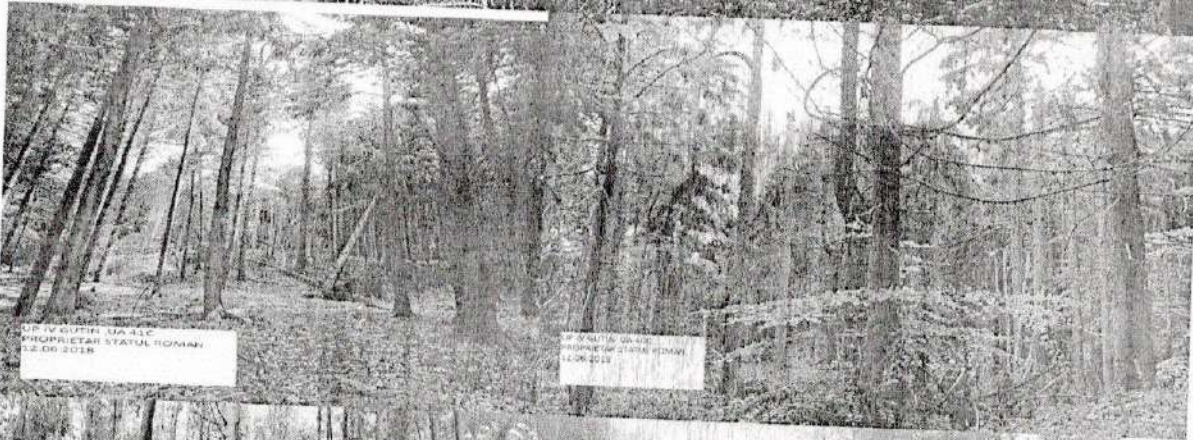
UP IV GUTIN UA 41C PROPIETAR STATUL ROMAN 12.06.2018