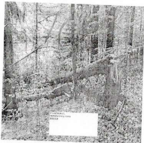
UP IV GUTIN UA 48A PROPIETAR STATUL ROMAN 12.06.2018