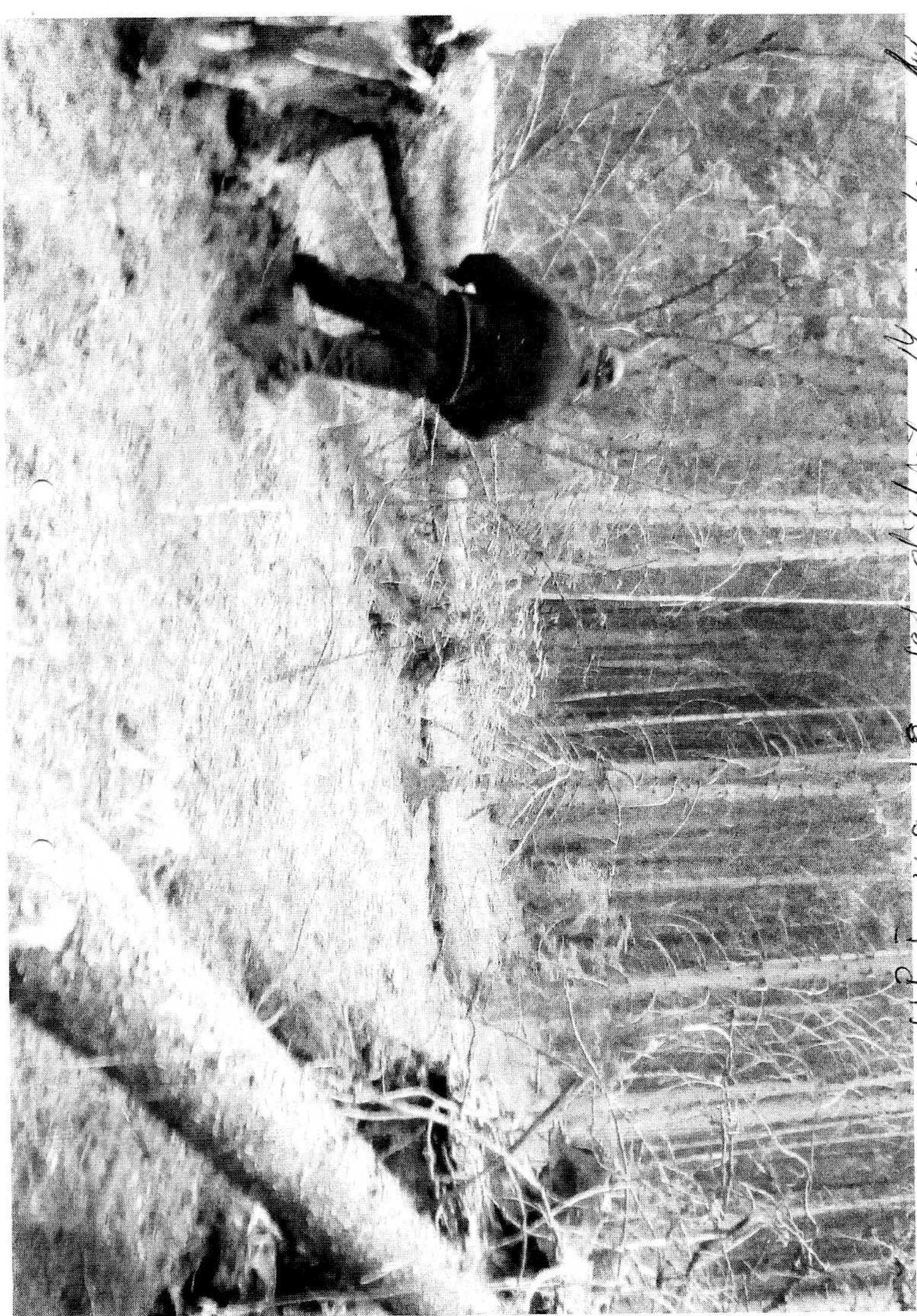
UPI, wa. 19, set disdret. Muroson leaba /