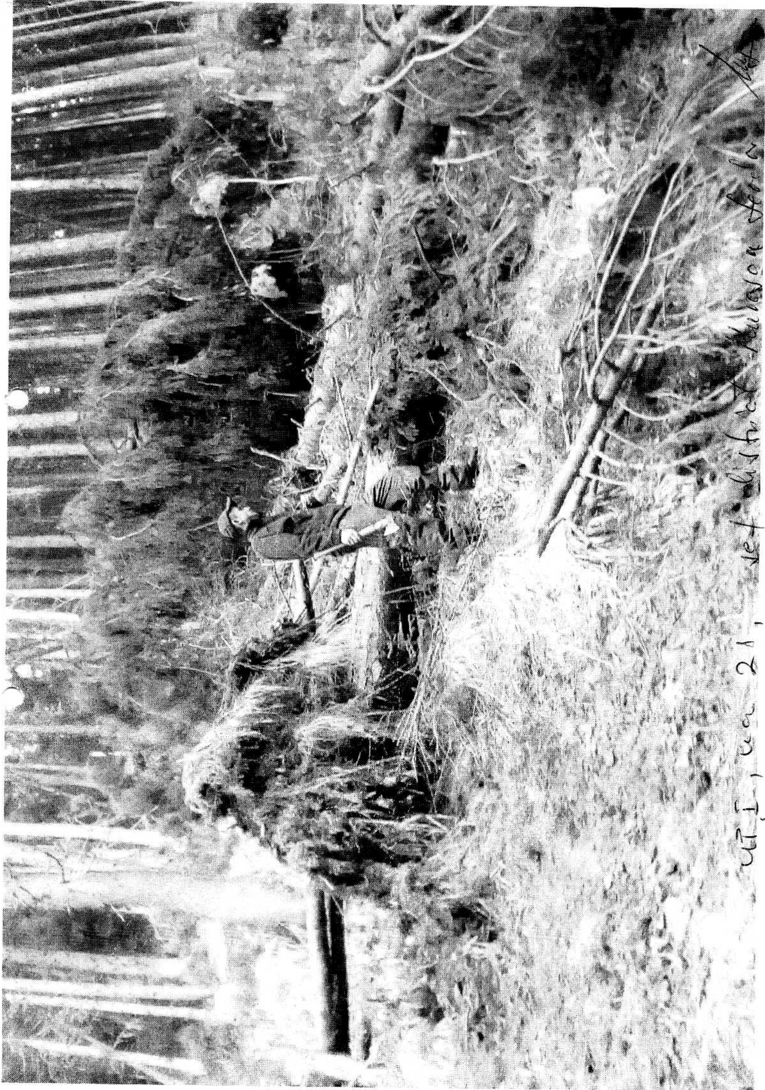
UT I, ca 21, def district, Mazon Fork